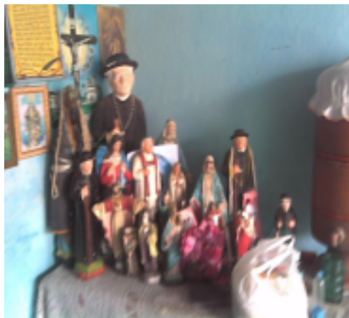
Figura 2 - Altar composto por expostos santos.