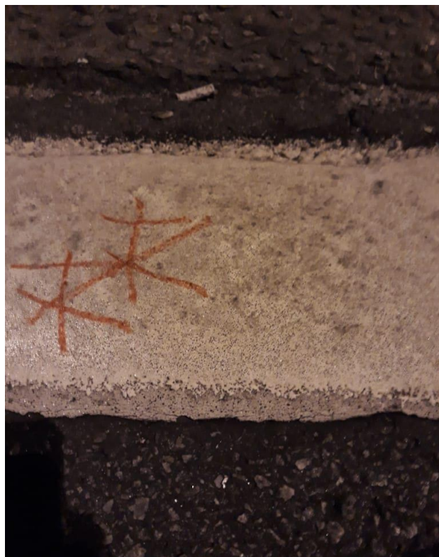
Figura 6. Assinatura humana feita no chão do Minhocão durante a noite, período em que se encontra aberto para os pedestres. 16

Apontamos neste artigo que usos reais que as pessoas fazem dos espaços são determinantes para a emergência de sua definição e para a caracterização de suas qualidades, que podem ser distintas do status oficial, político-administrativo, que possui. Os usos mostram que um espaço pode ter significados diversos para pessoas diversas em ocasiões distintas e que seus atributos surgem na interação e se consolidam no tempo, com a potência de transformar definitivamente espaços privativos em espaços públicos e ampliadores da cidadania.