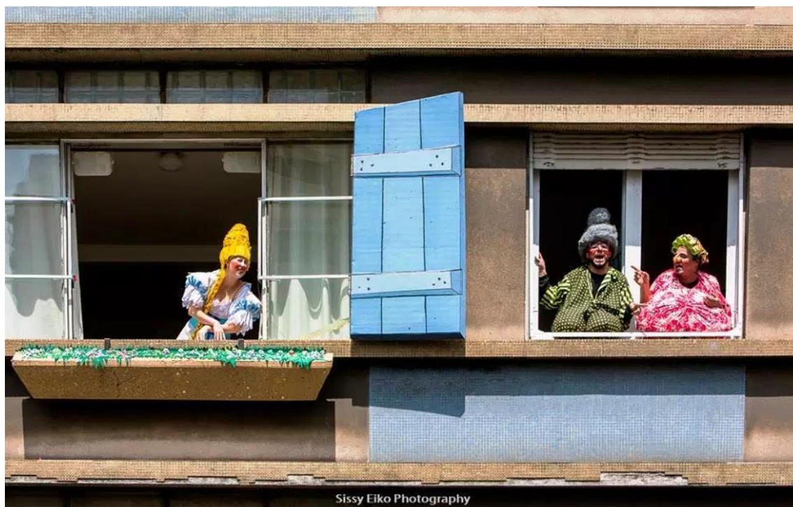
Figura 4. Apresentação do grupo teatral Esparrama em janela aberta para a pista do Minhocão, em 2016. 13

Estar no Minhocão é uma atitude transformadora, pois sua definição está em jogo desde o dia 25 de janeiro de 1971, quando o grande trânsito de sua inauguração fora prenúncio de um desastre sócio-urbanístico. 14 Os usos concretos dados a essa via elevada transformaram um deserto de origem autoritária em espaço vivo e democrático, socialmente saudável, que incorpora as demandas das pessoas e faz sentido na reprodução de suas vidas cotidianas. Hoje se discute qual será a forma futura desse novo parque, o que ele agregará, qual será sua extensão, que usos lhe serão garantidos, etc. A resposta a tais questões pode ser enriquecida a partir da análise antropológica e sociológica do Minhocão, que coloca as pessoas, suas relações, ações e visões de mundo no centro do pensamento sobre o urbanismo. Os objetos em contestação sobre essa via elevada não são - isoladamente - sua estrutura de concreto armado, ou as vigas de metal que ainda são valiosas para o Estado nem a poluição que