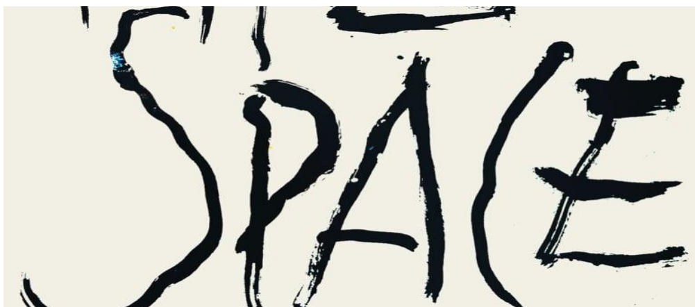
Figura 5. Trecho do registro videográfico da performance "Estado de Jogo", de Lena Kilina, 2018. 15

Adaptado de "O Urbanismo" - Le Corbusier