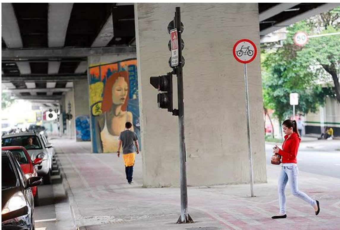
Figura 2. "Apagaram tudo, pintaram o muro de cinza" (MONTE, 2000). Colunas de sustentação do Minhocão são pintadas de cinza por agentes da prefeitura municipal de São Paulo, no ano de 2017. 10

definição do significado e dos usos dos espaços na cidade, que cruzam razões econômicas, políticas, culturais, históricas, identitárias, entre outras. Por isso, a arte de rua, como a vivenciamos hoje, é uma expressão altamente politizada em sua forma de existência, que se relaciona a permanência em um aparelho urbano - calçada, parede, pilastra, escada, etc - cuja identificação enquanto disponível para a realização de arte não é consenso entre os atores do espaço, gerando, assim, conflito (Campos, 2017). Os grafites e pixos que tradicionalmente colorem as colunas de sustentação do Minhocão também foram alvo da política pública intolerante da prefeitura de João Dória com a arte de rua, foram pintados de cinza.