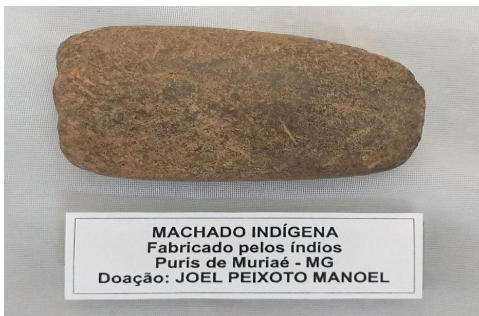
Imagem 5: Ponta de machado de tradição Puri encontrado em Muriaé – MG e exposto no acervo do Memorial Municipal