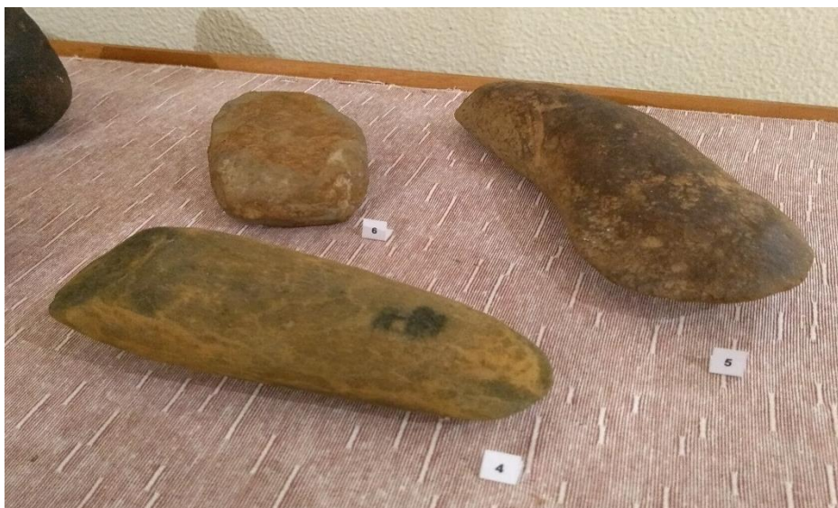
Imagem 4: Pontas de machado encontradas respectivamente nas fazendas Prosperidade e Fazenda Santa Inês, ambas localizadas no município de Miracema