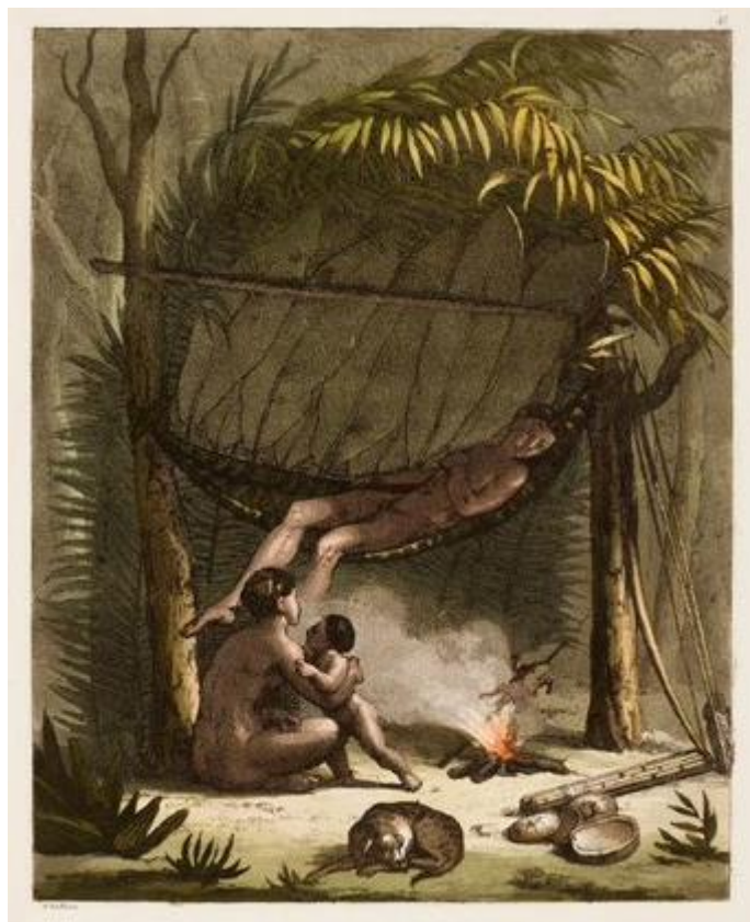
Imagem 7: Cuari ou Cabanas dos Puri. MAXIMILIAN, Prinz von Wied. 1821.

A imagem acima representa uma pequena construção de moradia dos Puri, muito provavelmente para o descanso durante seus deslocamentos. Quando paravam, construía casas ( ngwara ) simples, feitas de folhas de palmeiras, helicônias e patioba para se abrigarem (WIED-NEUWIED, 1989). Quando se fixavam em um local por um tempo maior, construía casas mais bem reforçadas. Em decorrência do avanço colonial após o contato, os Puri desenvolveram uma estratégia para conseguirem sobreviver e fugir dos seus algozes. Eles se organizavam em grupos que, por sua vez, se dividiam em grupos menores para irem se estabelecendo no território.