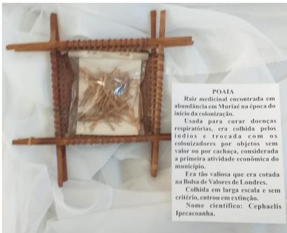
Imagem 2: Poaia ressecada em exposição no acervo sobre a história dos Puri exposto no Memorial Municipal de Muriaé – MG

Fonte: Site do Memorial Municipal de Muriaé 8