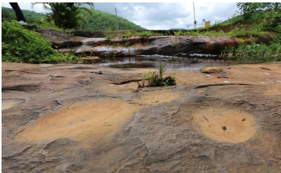
Imagem 3: Sítio arqueológico polidor amolador fixo encontrado na Fazenda Santa Inês em Miracema - RJ correspondente à presença dos Puri

fazenda Santa Inês, na localidade do distrito de Paraíso do Tobias, revelam que ali “funcionava uma espécie de oficina em que povos antigos que viveram na região elaboravam artefatos, como machados, em suportes de grandes blocos ou superfícies rochosas, deixando várias marcas de polimento ou amolação no local” (2012, p.17). Logo, neste córrego eram confeccionados instrumentos e ferramentas polidas que, segundo a pesquisa, tratavam-se de furadores, bastões, agulhas, arpões e machados, bem como bacias e pratos (MANDARIM, 2012, p. 17-18).