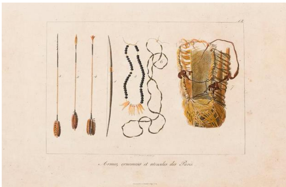
Imagem 8: “Armes, ornemens et utensiles Puri” - Maximilian Von Wied – 1822

Os cestos usados para coletar alimentos e transportar frutas, utensílio e também crianças, eram feitos das fibras vegetais da embaúba e de folhas de palmeiras, sendo resistentes pois percorriam muitas vezes longos caminhos na coleta de alimentos. Esses cestos eram presos à testa ou à cabeça por uma alça.