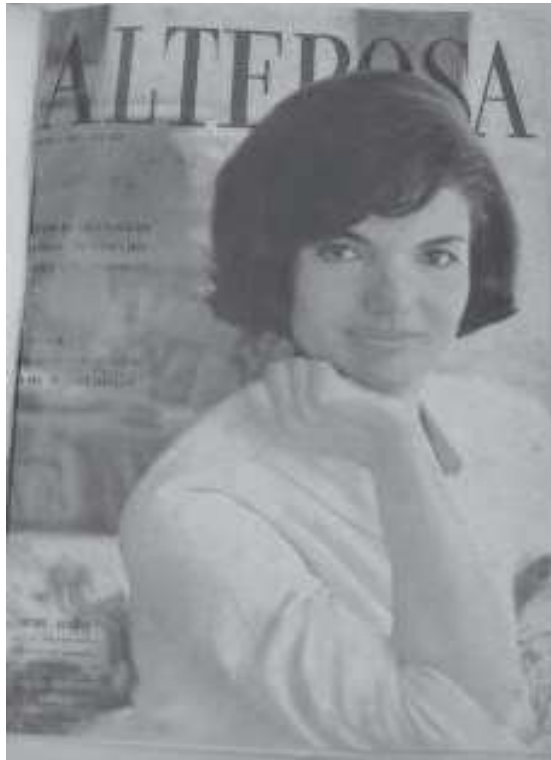
Figura 04: Jacqueline Kennedy – capa da “nova” Alterosa

famosa Cruzeiro –, papel e impressão gráfica de melhor qualidade, títulos longos, grandes reportagens nacionais e internacionais. A primeira edição da “nova Alterosa” trazia na capa a bela e elegante Jacqueline Kennedy (Cf. fig.04). Com viagem marcada para o Brasil, a primeira dama dos EUA era sucesso garantido na mídia, por isso amplamente cortejada pela imprensa mundial e mostrada como modelo ideal de mulher a seguida. Ditava moda, revolucionou a maneira de penetrar, de sorrir; mãe modelo; saía pelo mundo para ajudar ao marido. Nesse período eram constantes as comparações entre Jackie e Tereza Goulart, a também bela, elegante e “amada” primeira dama do Brasil, a única primeira-dama no mundo que fazia face a Jackie. A revista lançava mais uma polêmica: “Quem é mais elegante, Jackie ou Tereza Goulart?” (Alterosa, ago./1962, p.6).