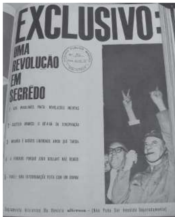
Figura 05: Suplemento Histórico da Revista Alterosa sobre o Golpe Militar de 1964

O Suplemento começa com a matéria intitulada “História de uma glória feita sem sangue” onde descreve a participação, narrada como “heróica”, do governador Magalhães Pinto – que mais tarde romperia com os militares – na organização e desencadeamento do golpe: