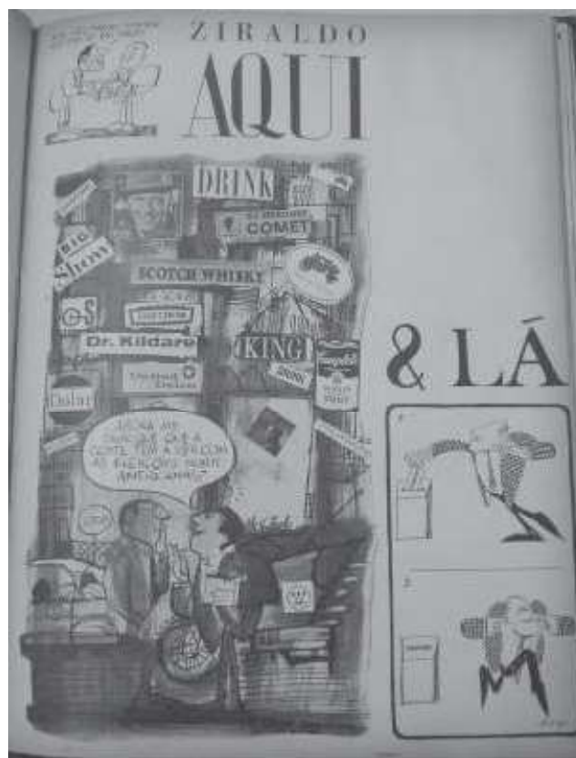
Figura XX: Charge de Ziraldo sobre eleições norte-americanas em 1964

Também na seção de “humor” aparecia a crítica indireta ao novo regime. Em julho Henfil criou e publicou a primeira estória dos Fradins – Baixim e Cumprido – que se tornariam mais tarde personagens famosos dos quadrinhos nacionais. Foram cinco quadros onde dois frades jogam nos transeuntes frutos colhidos da árvore em que estavam escondidos. Segundo Silva ( apud Pires 2006, p.99), nessas estórias “não se identifica ‘oposição entre Baixim e Cumprido e sim entre ambos e os outros”, mas é notória a introdução da ‘metáfora do poder militar”. Ziraldo por sua vez satiriza a influência norte americana no país; a edição de out./ nov. de 1964 sua charge é sobre as eleições nos Estados Unidos.