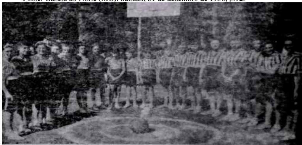
Figura 4 - Team feminino de basket-ball do Instituto Norte-Mineiro de Educação - 1938.