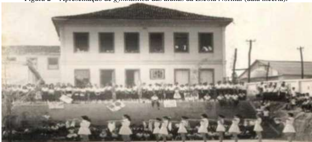
Figura 2 - Apresentação de gymnastica das alunas da Escola Normal (data incerta).