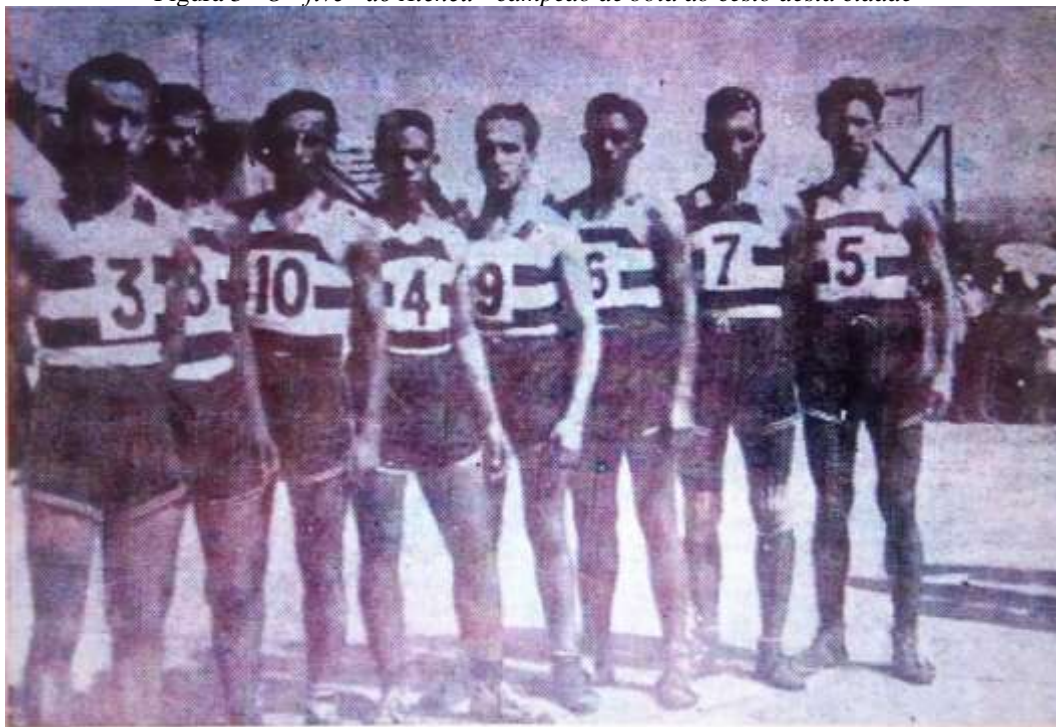
Figura 3 - O “five” do Ateneu - campeão de bola ao cesto desta cidade