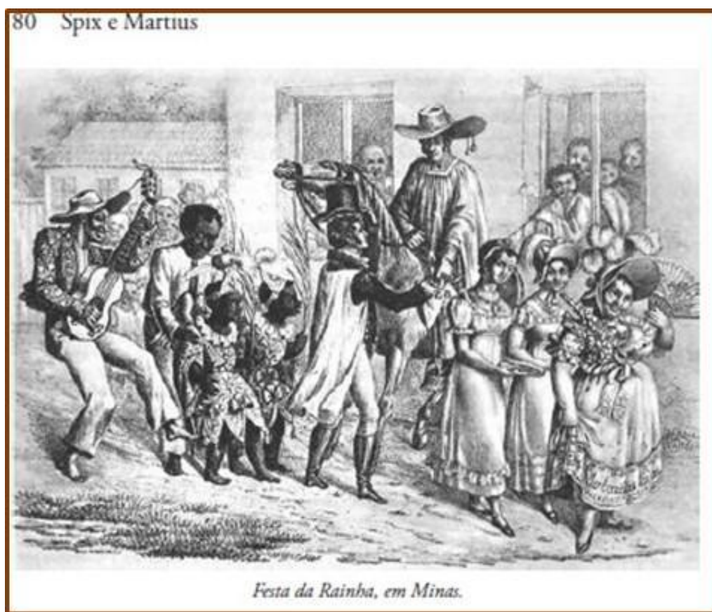
Figura 03 - Ilustração denominada de Festa da Rainha – Minas Gerais realizada como ilustração do texto do livro Viagens pelo Brasil de Spix e Martius. Fonte: SPIX; MARTIUS, 2017b, p. 80.

Este episódio, relatado por Spix e Martius, demonstra a curiosidade na diversidade cultural que levou esses autores a acompanhar e registrar detalhadamente esta festividade ao longo dos dois dias, numa análise comparativa em relação aos padrões musicais de centros urbanos europeus, que se refletem nas descrições como festa ruidosa e de estranhos passos. Destacam ao seu final: “Quão interessantes são as reflexões do pensador, que, em retrospecto e visão do futuro, se ligam a essa estranha festa” (SPIX; MARTIUS, 2017b, p. 62).