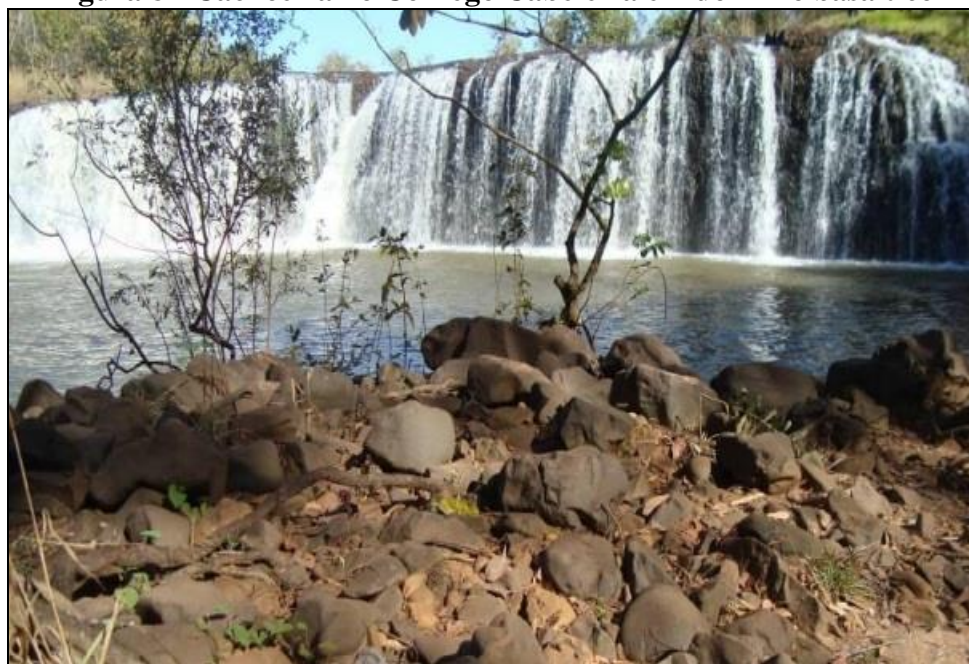
Figura 8 - Cachoeira no Córrego Cabeleira em domínio basáltico