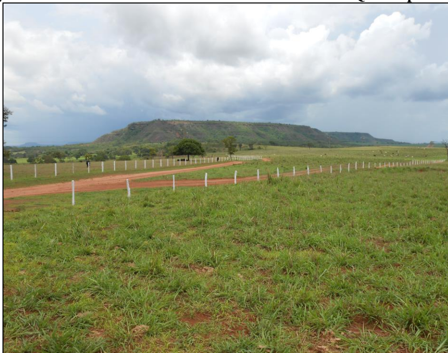
Figura 1 -Visão da Serra da Confusão do Rio Preto em Quirinópolis / GO