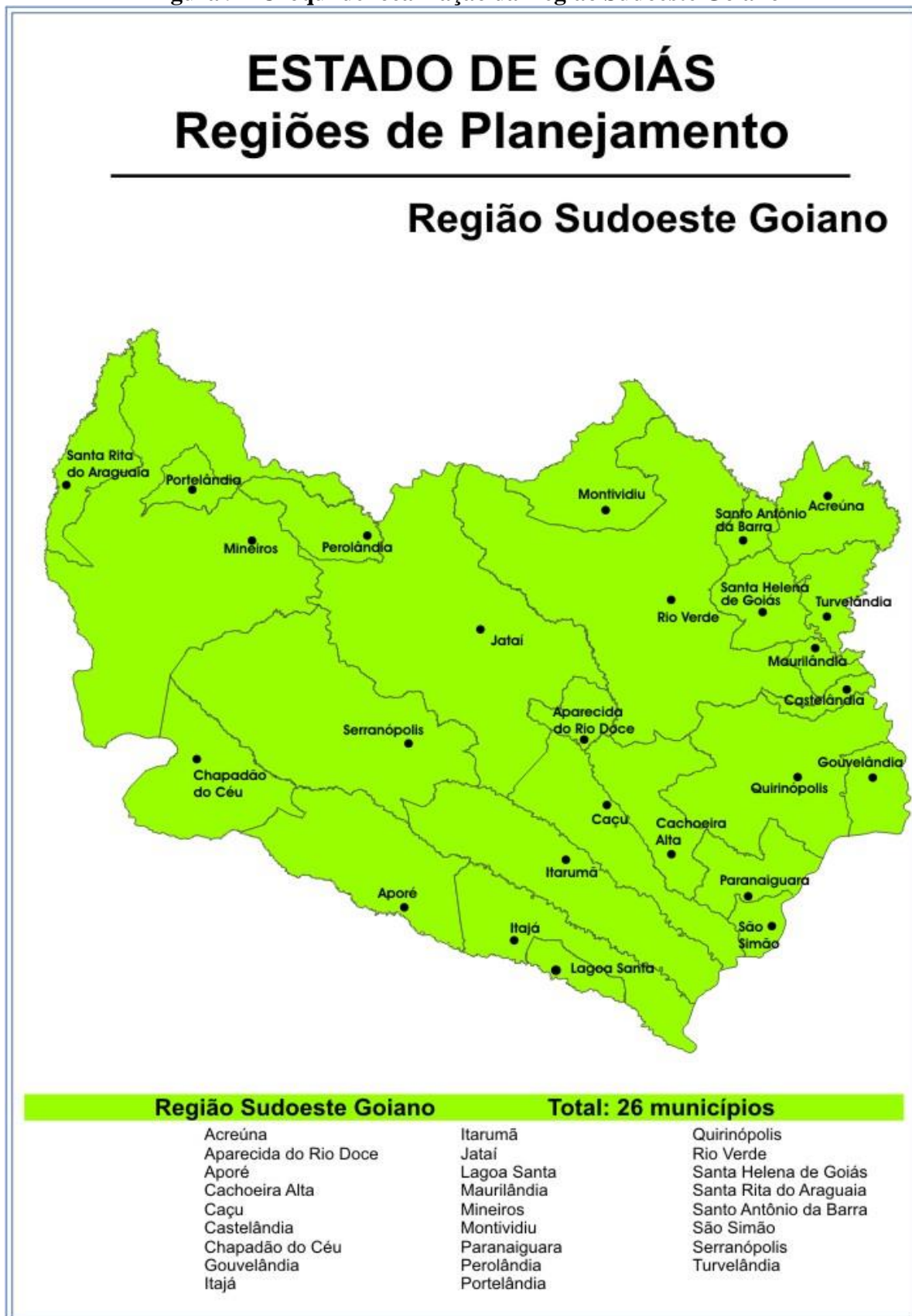
Figura 9 - Croqui de localização da Região Sudoeste Goiano