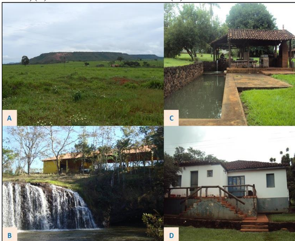
Figura 7 - Cenários na Serra da Confusão do Rio Preto: (A) Vista da serra com atividade rural na circunvizinhança, (B) Cachoeira do Córrego Cabeleira no Vale do Cedro, (C) Vista da Fazenda Cabeleira e (D) Sede da Fazenda Cabeleira