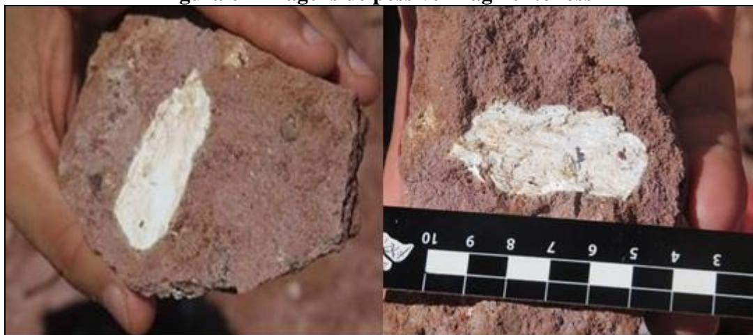
Figura 6 - Imagens de possível fragmento fóssil