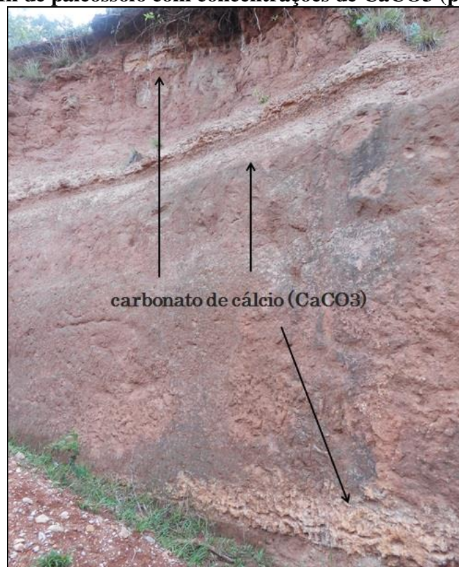
Figura 5 - Perfil de paleossolo com concentrações de \text{CaCO}_3 (porções brancas)