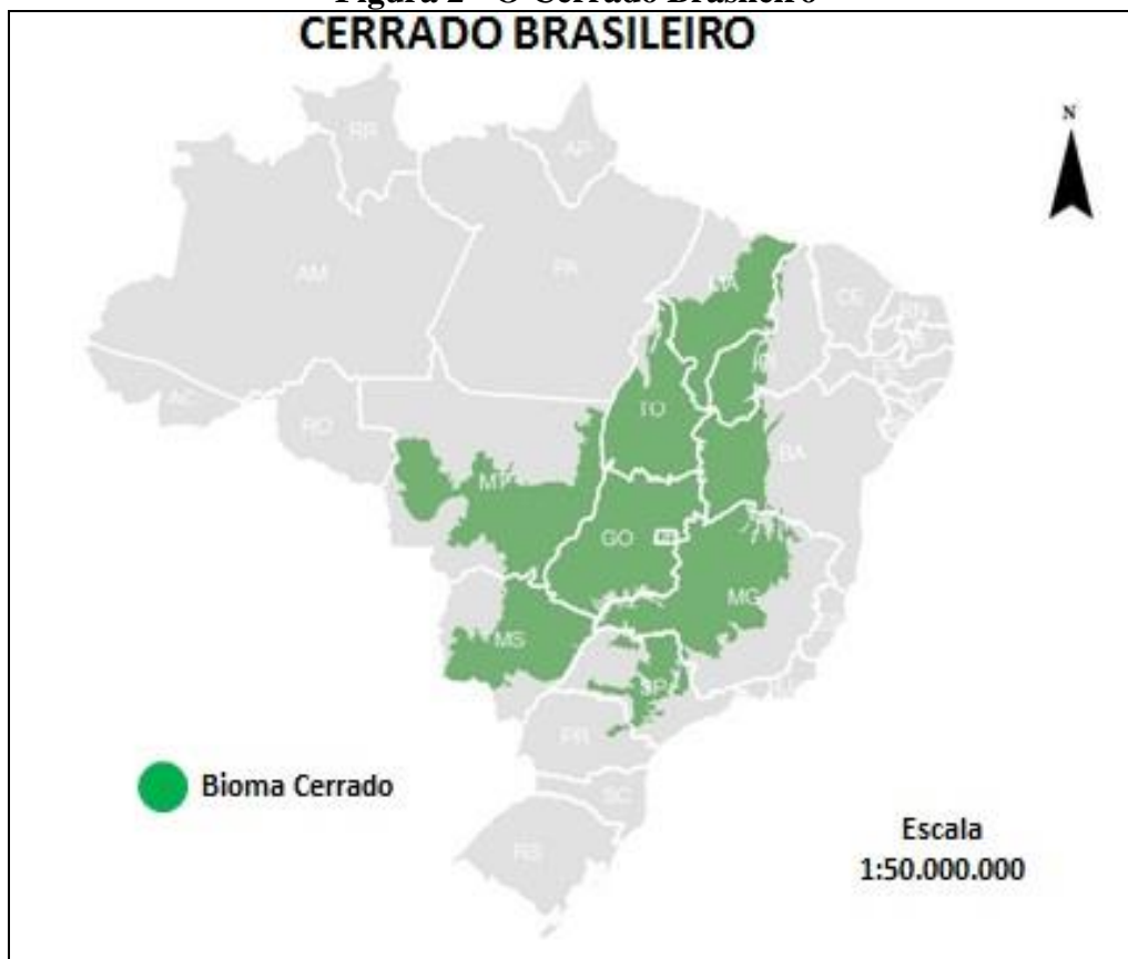
Figura 2 - O Cerrado Brasileiro