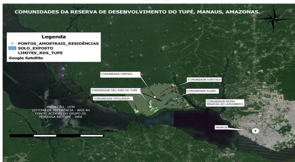
Figura 2 - Comunidades da Reserva de Desenvolvimento Sustentável do Tupé, Manaus, Amazonas

A área de estudo localiza-se na Amazônia brasileira. Localizada à margem esquerda do Rio Negro, a RDS do Tupé (Figura 2) é uma área de proteção ambiental situada na zona rural de Manaus. Possui 12.000 hectares de extensão, e abriga em torno de 1.800 moradores fixos no interior de seus limites, distribuídos em seis comunidades, sendo cinco ribeirinhas (Tatulândia, São João do Tupé, Julião, Livramento e Agrovila) e uma de assentamento rural (Central). Neste estudo são analisadas apenas as comunidades ribeirinhas da RDS do Tupé, pois que partilham da mesma influência do ritmo das águas em seu modo de vida, criando, dessa forma, condições semelhantes para a construção de uma identidade coletiva ou com poucas variações em suas representações sociais (SERRA, 2002).