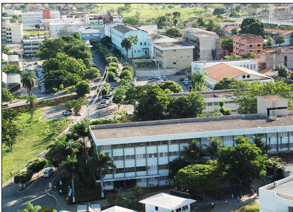
Figura 02 - Campus Unimontes