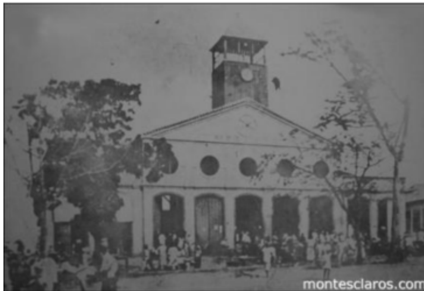
Figura 1 - Mercado Municipal de Montes Claros na Praça Dr. Carlos Versiane (hoje Shopping Popular)

Vale ressaltar que, nos arredores do mercado, pessoas de várias localidades se reuniam para comprarem e venderem, ao mesmo tempo. Assim, surgiram os estabelecimentos comerciais denominados de “secos e molhados” (produtos alimentícios, armazéns, armarinhos e lojas onde se vendia de tudo). A figura a seguir ilustra um pouco toda essa movimentação.