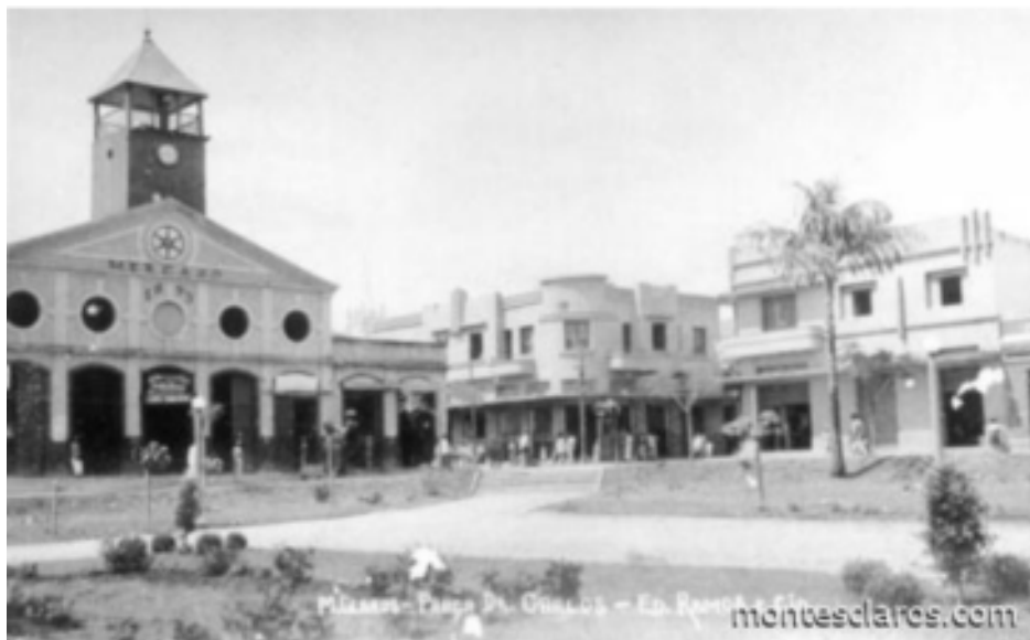
Figura 3 - Mercado Antigo, 1944