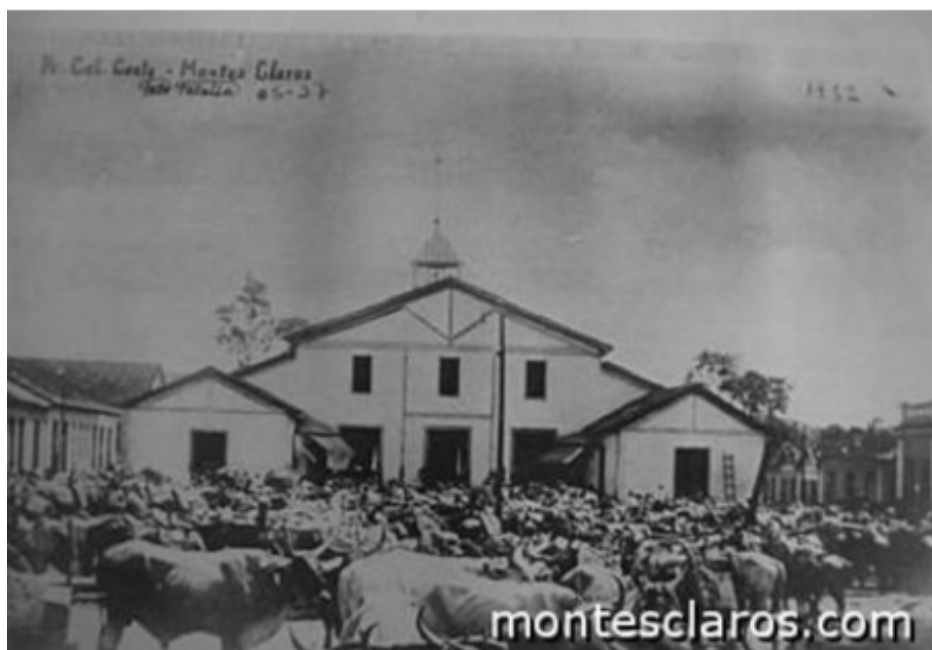
Figura 2 - A boiada no fundo do Mercado Antigo

A figura a seguir mostra a quantidade de animais que ficavam amarrados atrás do mercado, enquanto seus donos comercializavam.