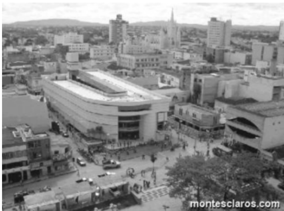
Figura 5 - Shopping Popular Mário Ribeiro Silveira - 2006 - Montes Claros - MG