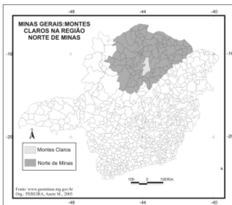
Mapa 1 - Minas Gerais/Norte de Minas. Localização do município de Montes Claros

sendo 97 quilômetros quadrados de área urbana e 3.485 quilômetros quadrados de área rural. Montes Claros conta com uma população total de 342.586 habitantes (IBGE, 2005). Como escreveu Pereira (2004), Montes Claros é o único município da região com população superior a 100 mil habitantes, o que permite classificá-lo como um município de médio porte, segundo critérios do IBGE.