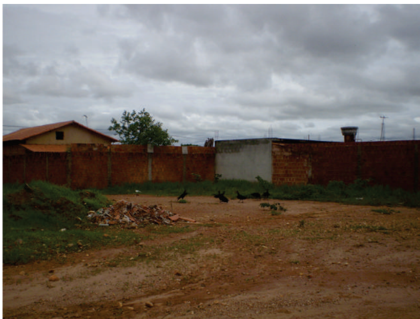
Foto 1: Entulho e urubus no bairro Independência próximo a domicílios

No bairro Independência, foi detectado o maior índice de notificação de dengue, nesse bairro não existe drenagem pluvial, porém possui água tratada e esgoto canalizado em toda a sua extensão, a coleta de lixo também acontece três vezes por semana, no entanto pode ser observado na Foto 1, lixo em lotes vagos, animais mortos e até urubus bem próximos às casas. O Presidente da Associação de Moradores deste bairro acredita que a grande quantidade de casos de dengue ali notificada se deve ao fato de constantemente faltar água no bairro e os moradores armazenarem água para consumo posterior de forma inadequada, além da quantidade de lixo e entulho jogados nos lotes vagos que possivelmente contém recipientes com água contribuindo para a proliferação dos mosquitos.