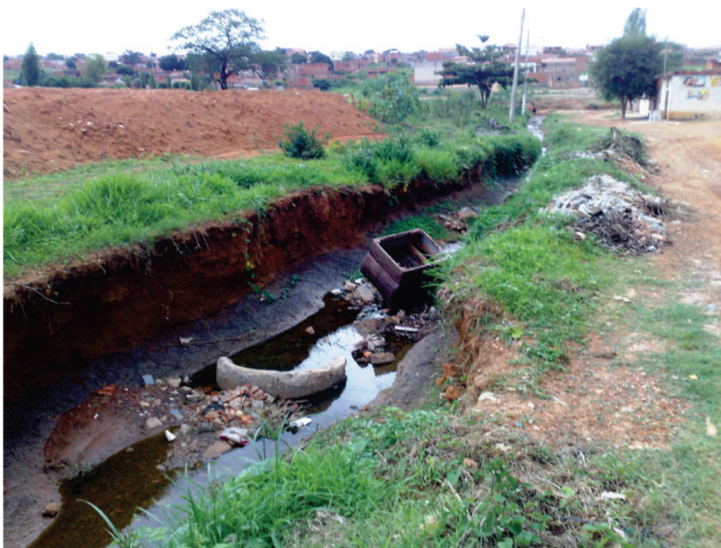
Foto 2: Esgoto e lixo em canal de águas pluviais no bairro São Judas Tadeu

O bairro São Judas Tadeu, com 279 casos de diarreia e 14 de dengue, também possui algumas áreas caóticas em relação ao saneamento básico como, por exemplo, a rua Pablo Leal Coutinho que à primeira vista mais parece um local de despejo de lixo e esgoto e em nada parece uma rua, até bastante transitável. Uma parte da rua é sem pavimentação e ao lado dela passa um canal feito pela Prefeitura para recolher águas pluviais (Foto 2), no entanto os moradores ligaram nesse canal os seus esgotos e estes escorrem a céu aberto por todo o trajeto até desaguar no rio Bicano. O Ex-Presidente da Associação deste bairro, informa que, quando chove, as casas próximas ao canal são invadidas pelas águas que transbordam, levando esgoto e lixo para dentro dessas casas. Morador desse bairro há muitos anos, afirma ainda que há 22 anos a população convive com essa situação e que, por mais que seja solicitada da Prefeitura uma solução para esse problema, nada foi feito. Aliada ao descaso dos órgãos públicos está a falta de conscientização das pessoas que jogam lixo no local, pois de acordo com o agente de combate às endemias do Centro de Zoonoses, recentemente a área foi toda limpa por uma empresa que está construindo um condomínio próximo ao local, no entanto em uma semana a área estava coberta de lixo novamente.