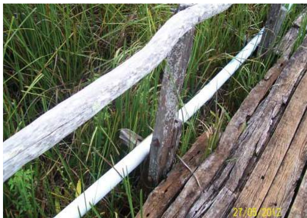
Figura 06: Tubulação na nascente do rio Riachão. Fonte: MOREIRA; SALES; COSTA; BATISTA e MENDES, 2012.