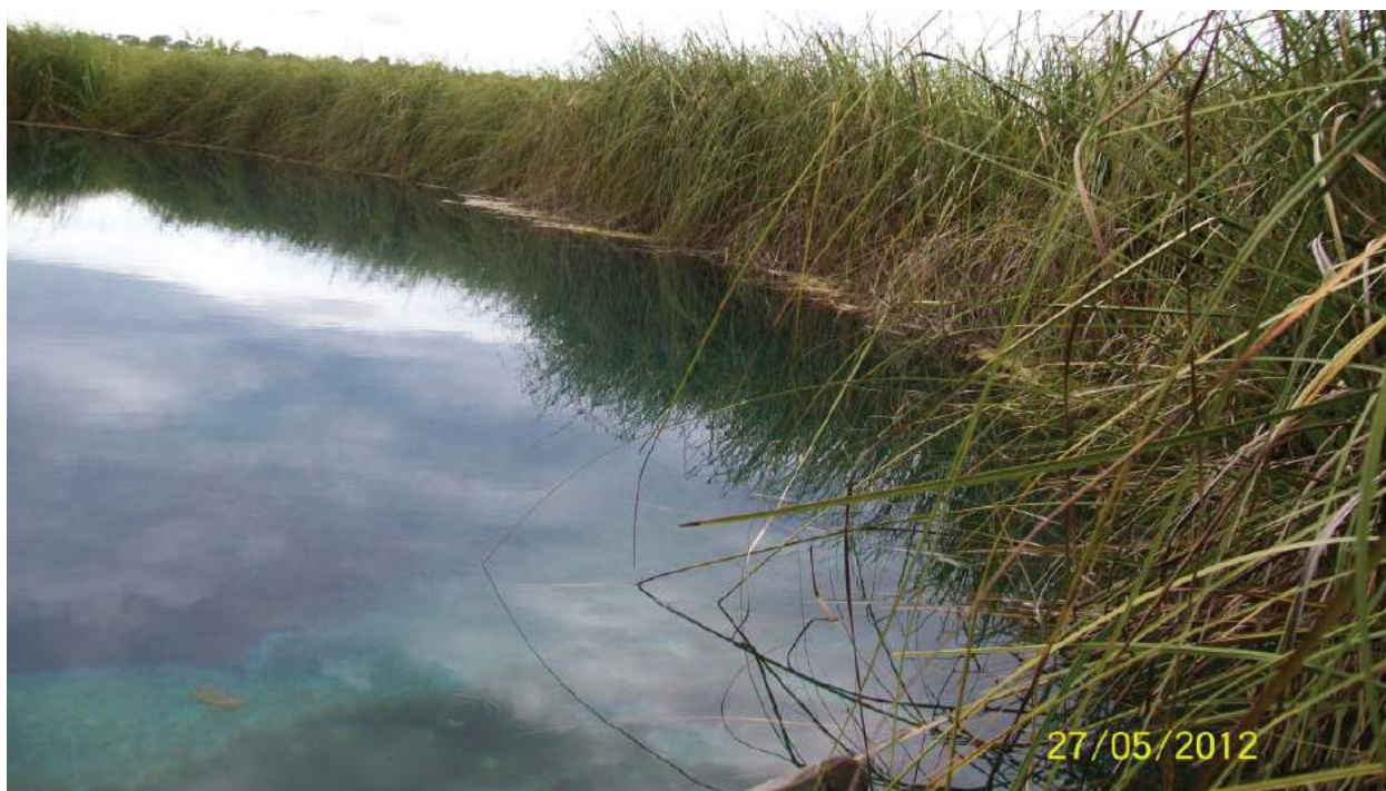
Figura 03: Taboas no entorno da nascente do rio Riachão.

Viola (2005) caracteriza a lagoa da Tiririca como um ambiente lântico, apresentando uma profundidade média de 9 m, com água fluindo debaixo da ponte, presença de bancos de areia na lagoa, passagem de animais e a presença de cultura irrigada nas imediações. Observou-se que a coloração da água apresenta-se esverdeada, com presença de pedras, algas escuras, peixes, além da predominância no entorno da nascente da espécie vegetal taboas, corroborando com a descrição de Viola (2005).