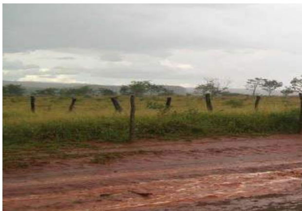
Figura 05: Erosão em sulcos.

Ao desmatar áreas próximas ao curso d'água os proprietários estão favorecendo o surgimento de locais com erosão e assoreamento do leito do rio. As consequências desses problemas, além de exigirem altos custos para a sua solução, podem interferir na disponibilidade hídrica do afluente afetado pelo processo de assoreamento, suscetíveis ao carreamento de terra para o leito do rio, pela erosão em sulcos e voçorocas e pelos pontos com tendência a desagregação. Isto foi percebido in loco onde houve ocorrência de precipitação no dia de uma das visitas técnicas, verificando-se, na ocasião, a presença de processos de erosão em sulcos no percurso da estrada que leva a nascente (Figura 5). Foram encontrados, também, na área no entorno da nascente a construção de grotas, barramentos improvisados para conduzir a água até as plantações e a presença de motobombas e tubulações para irrigação (Figura 6).