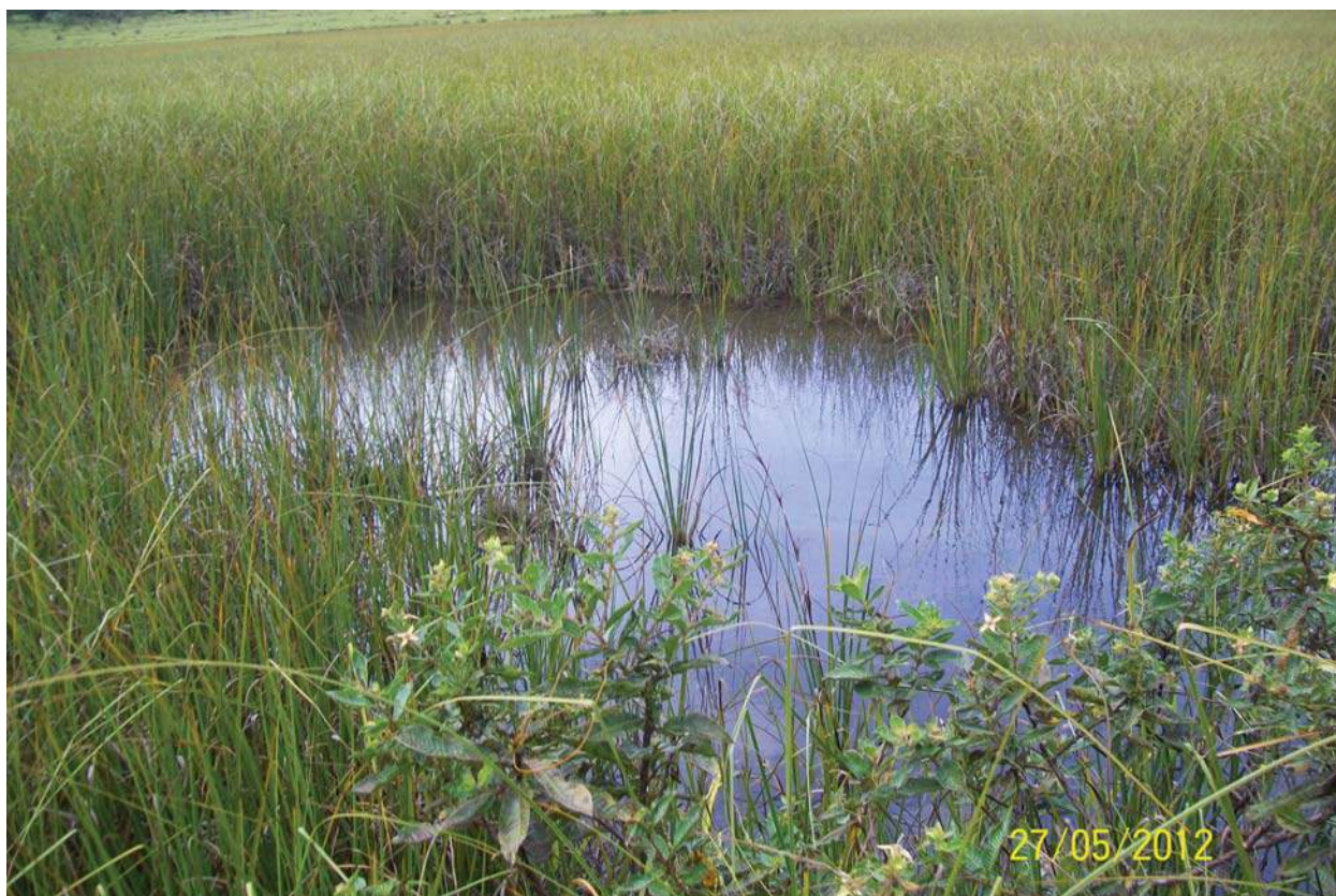
Figura 2: Fotos de uma das pequenas nascentes no entorno da nascente da sub-bacia do Riachão.