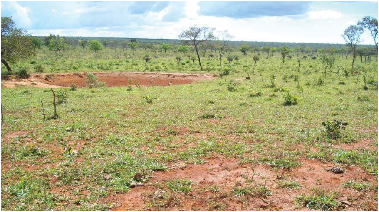
Figura 08: Barragem nas proximidades da Nascente do Riachão

As matas ciliares agem como filtros d'água que descem dos pontos mais elevadas e protegem as margens de processos erosivos, cooperando significativamente na redução do assoreamento. As matas no entorno de nascentes têm a função de proteção, garantindo a qualidade das águas (MARTINS; DIAS, 2001).