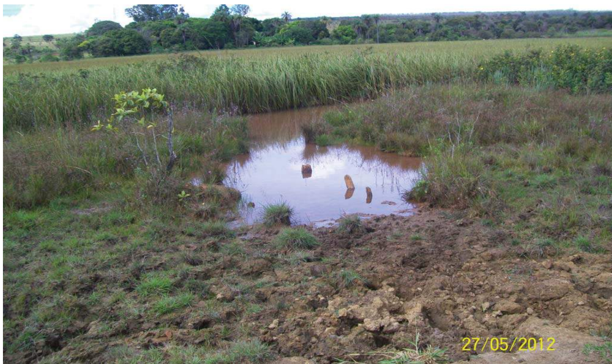
Figura 04: Solo erodido e pisoteado, como resultado da dessedentação de animais.

Ao desmatar áreas próximas ao curso d'água os proprietários estão favorecendo o surgimento de locais com erosão e assoreamento do leito do rio. As consequências desses problemas, além de exigirem altos custos para a sua solução, podem interferir na disponibilidade hídrica do afluente afetado pelo processo de assoreamento, suscetíveis ao carreamento de terra para o leito do rio, pela erosão em sulcos e voçorocas e pelos pontos com tendência a desagregação. Isto foi percebido in loco onde houve ocorrência de precipitação no dia de uma das visitas técnicas, verificando-se, na ocasião, a presença de processos de erosão em sulcos no percurso da estrada que leva a nascente (Figura 5). Foram encontrados, também, na área no entorno da nascente a construção de grotas, barramentos improvisados para conduzir a água até as plantações e a presença de motobombas e tubulações para irrigação (Figura 6).