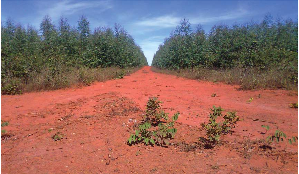
Figura 07: Plantio de Eucalipto.

Também pode ser observado um grande plantio de eucalipto, como mostra a Figura 07, aproximadamente a 4.000 m da nascente do Riachão, sendo que esse cultivo pode provavelmente comprometer o abastecimento de água. Almeida et al. (2007) afirmam que a sustentabilidade dessa prática silvicultural, devido ao uso da água, incita discussão generalizadas e exige esforços para a compreensão dos possíveis efeitos desse tipo de atividade, sendo estendido pela brecha na discussão quanto aos sistemas de manejo que podem causar impactos na conservação da água e do solo nas áreas cultivadas e colocar em risco o abastecimento de água na região.