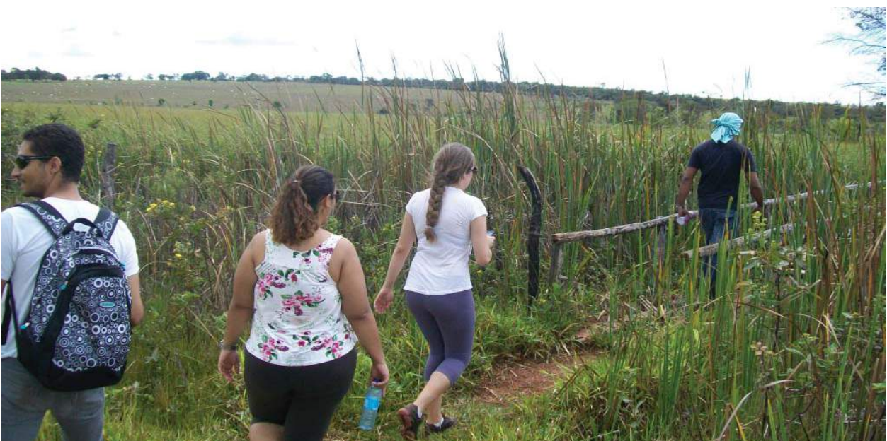
Figura 09: Ponte de acesso à nascente.

Devido à presença de vegetação aquática na mata ciliar da nascente do Rio Riachão, o acesso à nascente se dá por pontes de madeira construídas provavelmente pelo proprietário da área onde se situa a nascente. Essa ponte encontra-se em mau estado de conservação e não oferecem segurança para visitantes (Figura 09).