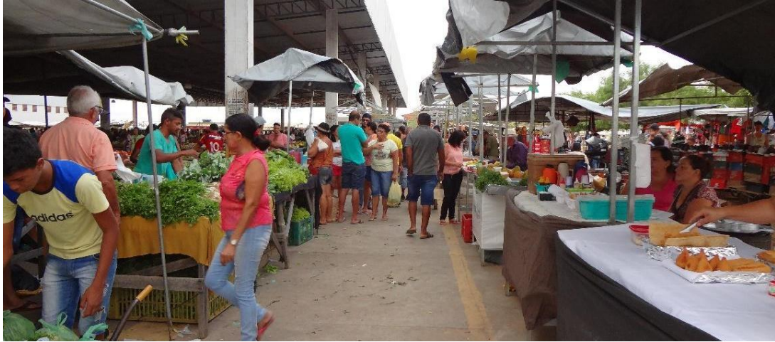
Figura 2 – Corredor da Feira de Euclides da Cunha

produtos; no corredor, os fregueses conversando entre si e olhando as mercadorias, à esquerda, as hortaliças e, à direita, lanches.