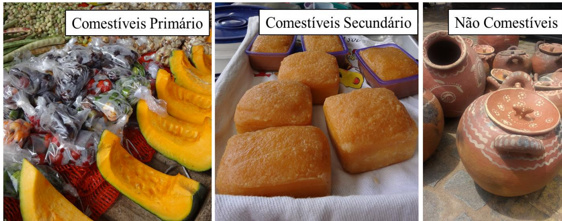
Figura 3 – Tipologia dos produtos comercializados na feira de Euclides da Cunha

(NC): produtos não apropriados para consumo humano. Essa tipologia está exemplificada na figura 3.