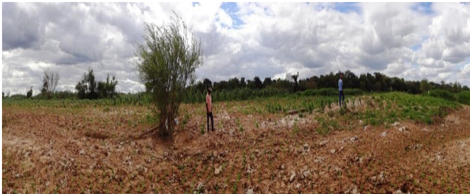
Figura 3. Agricultura de vazante