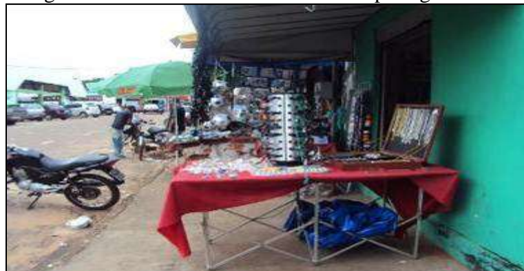
Fotografia 05 - Marcas de uma cultura na paisagem urbana