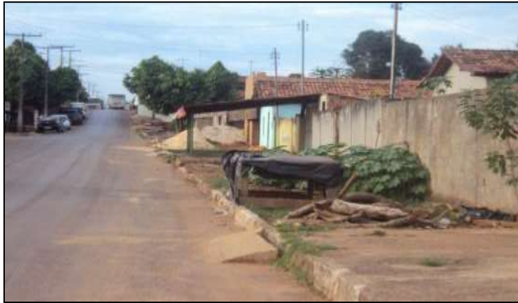
Fotografia 4 – Irregularidade Urbana: Área em cima da calçada