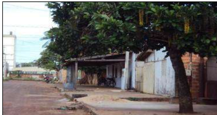
Fotografia 1 - Área da casa no local da calçada no Bairro JK