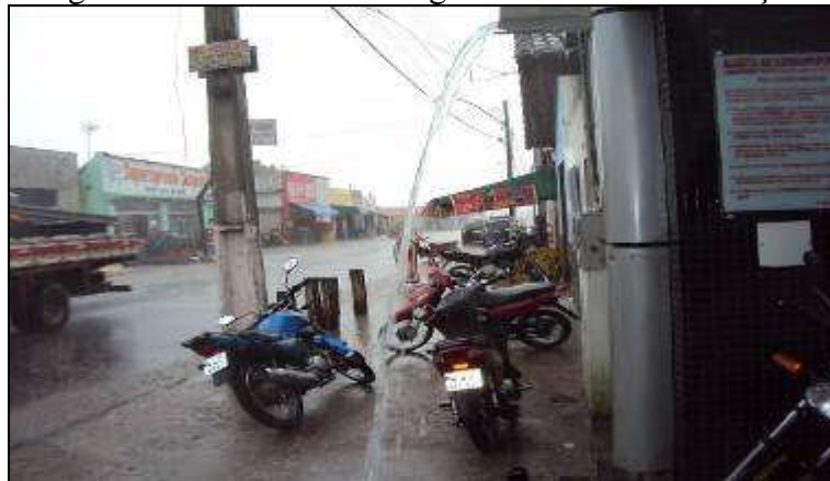
Fotografia 2 – Uma “bica de água” caindo sobre a calçada