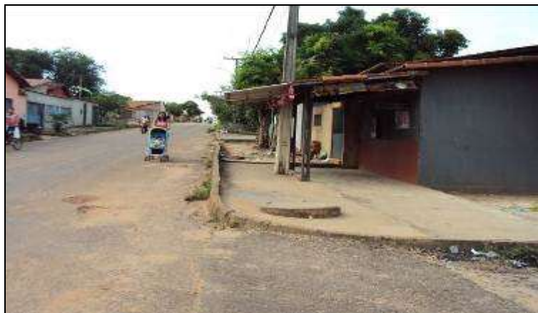
Fotografia 5 - Área da casa avançando por sobre a calçada

Fonte: PEREIRA, Aires José. Pesquisa de campo realizada em outubro de 2017.