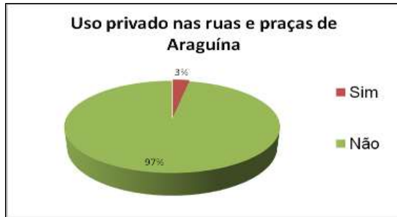
Gráfico 01 - Apropriação do espaço público por agentes privados em Araguaína – TO