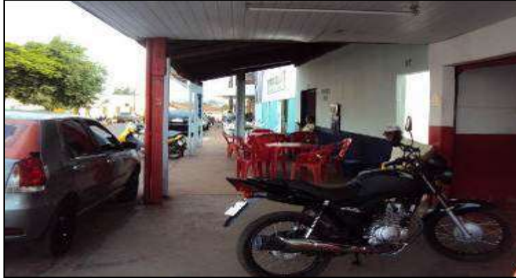
Fotografia 06 - Araguaína: mesas, cadeiras e moto na calçada