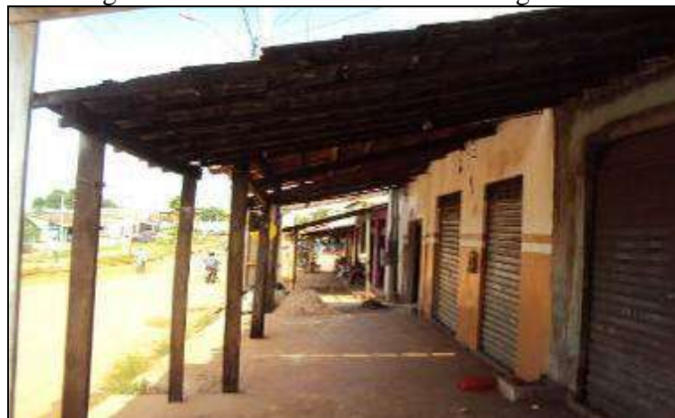
Fotografia 3 - Uma cena comum em Araguaína