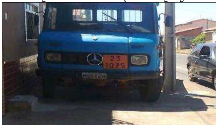
Fotografia 6 - O uso da calçada como garagem

Fonte: SILVA, Marivaldo Cavalcante da. Agosto de 2016.