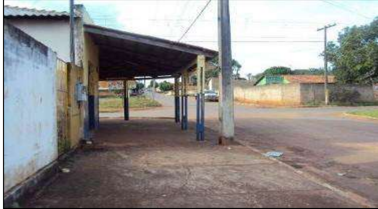
Fotografia 01 - Irregularidade Urbana: Área em cima da calçada