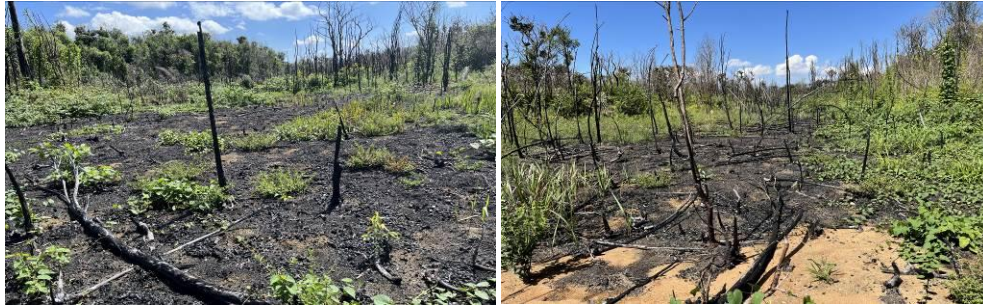
Figura 5 – Registros dos incêndios florestais que ocorreram em setembro de 2022 no PNB