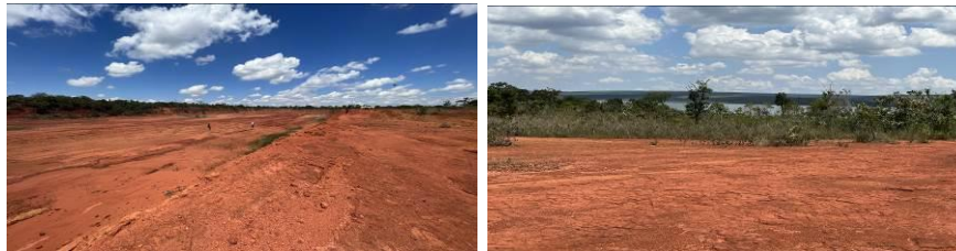
Figura 3– Processos erosivos nas proximidades da Represa Santa Maria no PNB – área utilizada como “caixa de empréstimo” para a construção da represa