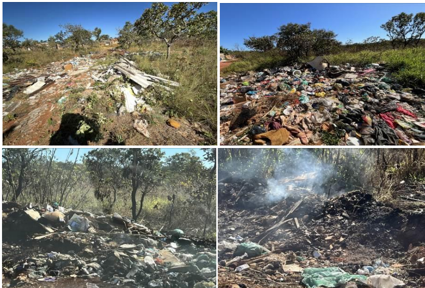
Figura 4 – Disposição inadequada e queima de resíduos sólidos no PNB

O descarte inadequado e a queima de resíduos sólidos no espaço interno (Figura 4) e no entorno do PARNA são uma forte ameaça que contribui para alteração do microclima local, poluição visual, do solo, do ar e da água; aumento na incidência de queimadas e incêndios florestais, proliferação de vetores, perda de habitat e da biodiversidade, aumento da incidência da dengue, chikungunya e zika. Também favorecem a introdução de espécies invasoras e aumentam os problemas respiratórios devido aos poluentes químicos, resultando em maiores gastos públicos com saúde coletiva.