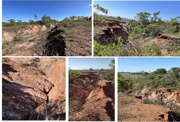
Figura 2 – Processos erosivos no PNB – área utilizada como “caixa de empréstimo durante” a construção de Brasília

Estrutural, desprovido de infraestrutura e saneamento básico adequados. Além dos impactos mencionados, destacam-se a degradação da paisagem, os riscos de explosões e a grande quantidade de sacos plásticos, que, por serem leves, são levados pelo vento para as proximidades e até mesmo para o interior do PNB e outras UCs.