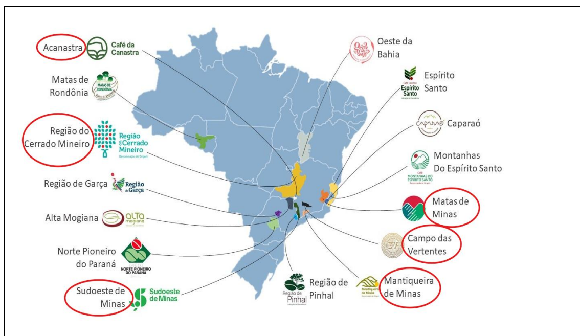
Figura 3: Regiões Produtoras de Cafés Especiais no Brasil