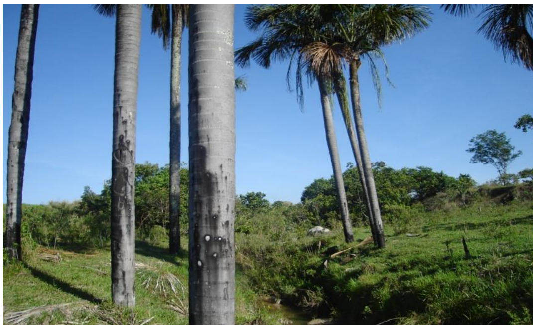
Figura 4 – Vereda no município de Goiandira (GO)

Na rodovia BR-050 (oitava parada), observaram-se uma vereda com vegetação bem densa e uma transição abrupta direta do cerradão para a vereda, além da samambaiçu ( Dicksonia sellowiana ); por conseguinte, a área foi definida como uma paisagem mista. No município de Goiandira (GO) houve a nona parada (Figura 4), onde se notaram vários pontos de vereda. No primeiro momento se destacaram o campo limpo e uma voçoroca em paisagens de estruturas de gnaisses intemperizados, sendo classificada como vereda de terraço com fundo chato, sedimentada por coluvionamento.