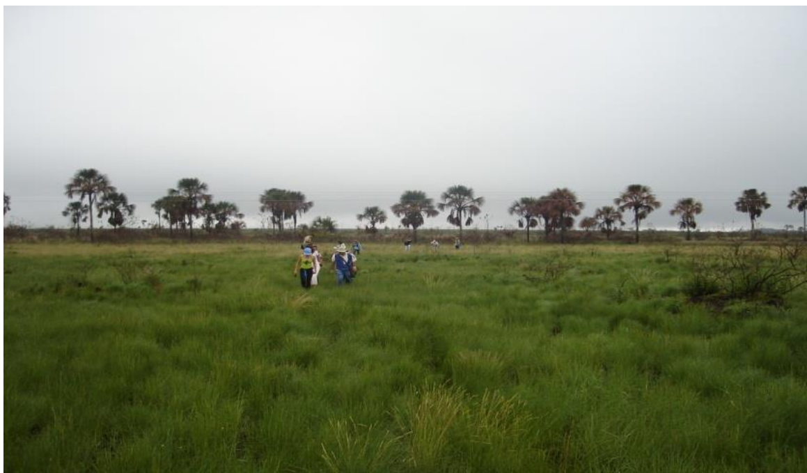
Figura 3 – Primeira parada na vereda do chapadão de Catalão

[...] logaritmo do inverso da atividade do íon hidrogênico de um solo. Na determinação do grau de acidez (ou alcalinidade) de um solo, por meio de um eletrodo especificado, o grau de umidade da amostra é expresso através da relação solo-água.