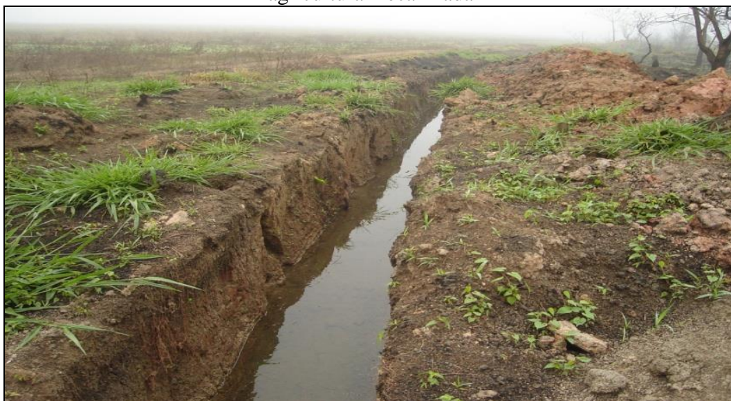
Figura 1 – Drenagem em vereda no chapadão de Catalão (GO), paisagem ocupada pela agricultura mecanizada

A ocupação acelerada da região do Planalto Central Brasileiro por projetos agrícolas cada vez mais tecnificado, a construção de barragens nas cabeceiras de drenagem, ambientes das Veredas, têm causado reflexos irreversíveis para a sobrevivência dos mesmos [ sic ], levando a perda de paisagens importantes para o Bioma Cerrado. A configuração de outros modelos de ambientes de Veredas talvez tenham se perdido nesse processo acelerado de destruição desses ambientes.