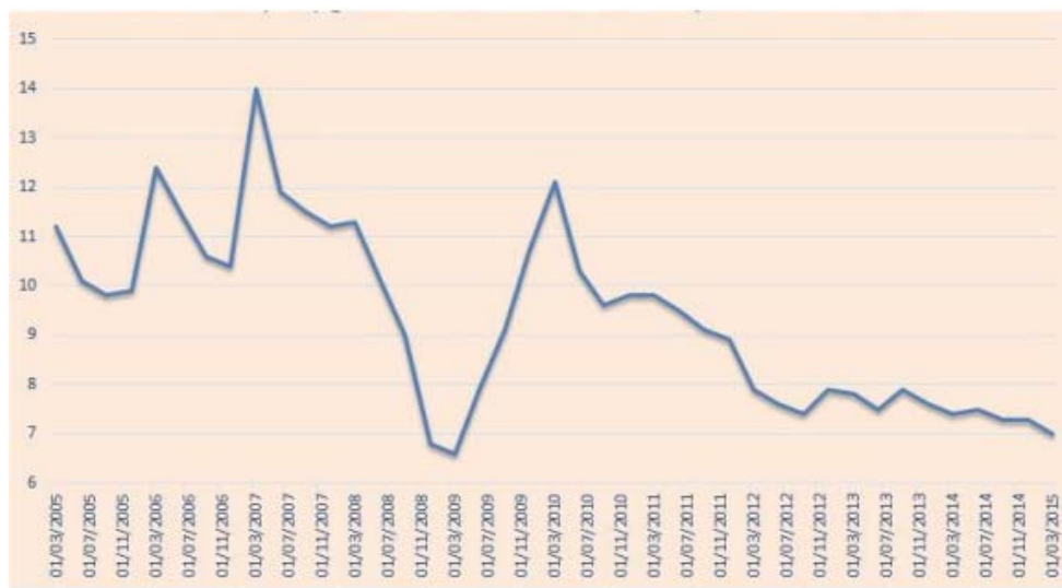
Gráfico 2 – Evolução do PIB da China – 2005-2015 (quadrimestres) em %.

Fonte: National Bureau of Statistics, China.