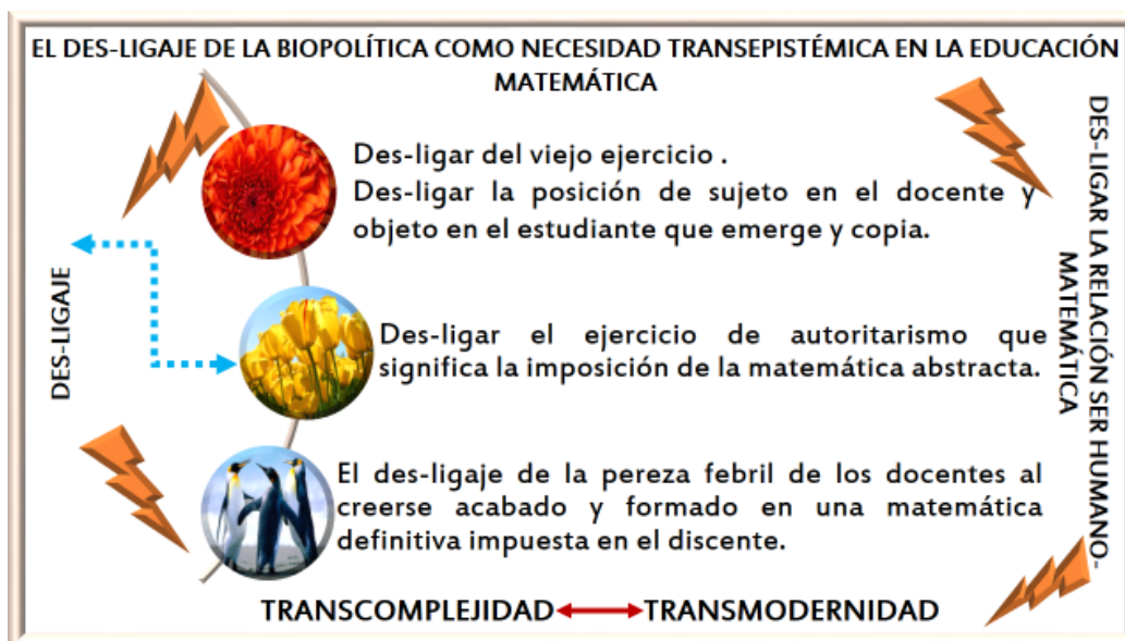
Figura 3: Elaboración de la Autora

En lo que sigue se presenta un gráfico que pretende resumir el rizoma actual.