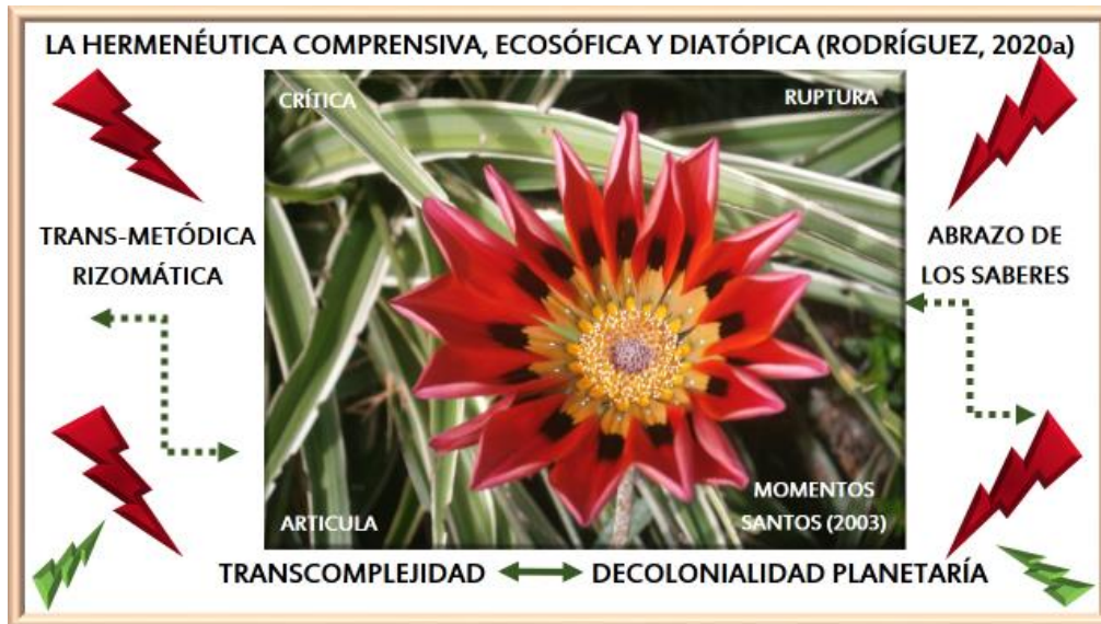
Figura 1: Elaboración de la Autora

Se realiza un gráfico a fin de presenta el presente rizoma en cuanto a su transmétodo y como se configura en la investigación (Figura 1).