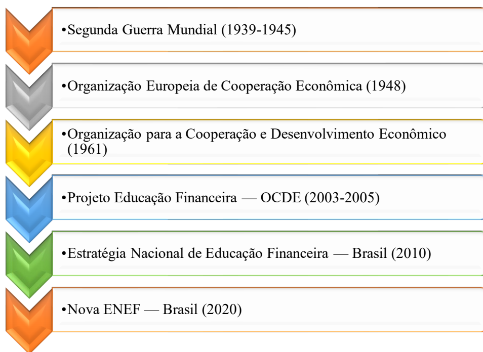
Figura 1: Aspectos históricos que influenciaram no desenvolvimento da Educação Financeira (Elaboração própria, 2024)