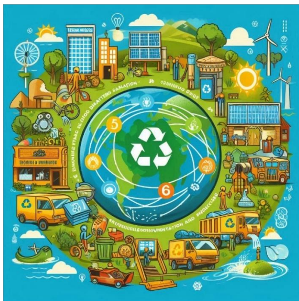
Figura 3: Ensino de Matemática e sustentabilidade (Elaboração própria utilizando IA)

Utilizando Inteligência Artificial (Microsoft Designer) e elementos da Figura 2, a Figura 3 foi criada para mostrar como práticas educativas no ensino de Matemática podem promover a Educação para o Desenvolvimento Sustentável.