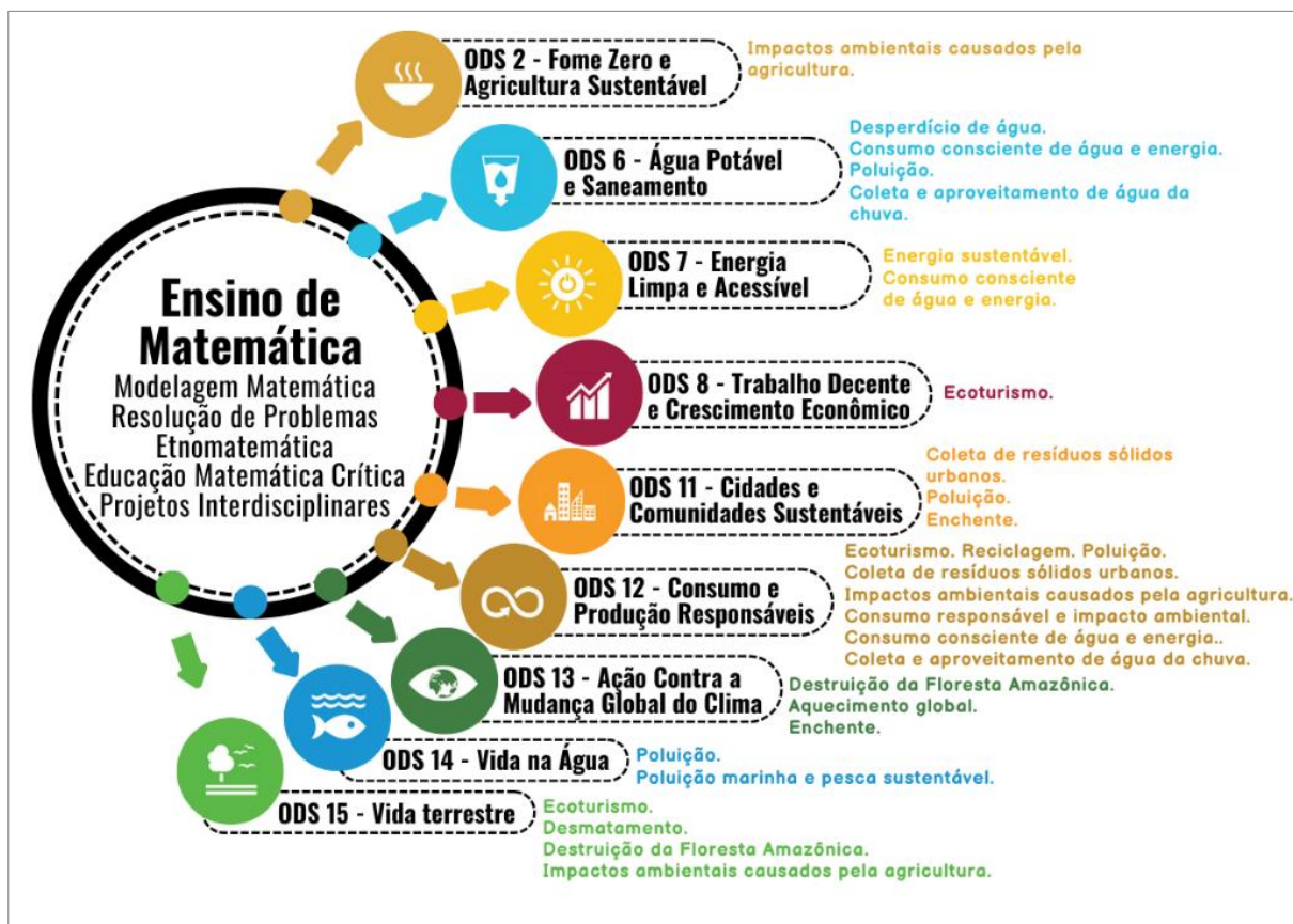
Figura 2: Temas utilizados nas práticas educativas e os ODS (Elaboração própria)

Utilizando Inteligência Artificial (Microsoft Designer) e elementos da Figura 2, a Figura 3 foi criada para mostrar como práticas educativas no ensino de Matemática podem promover a Educação para o Desenvolvimento Sustentável.