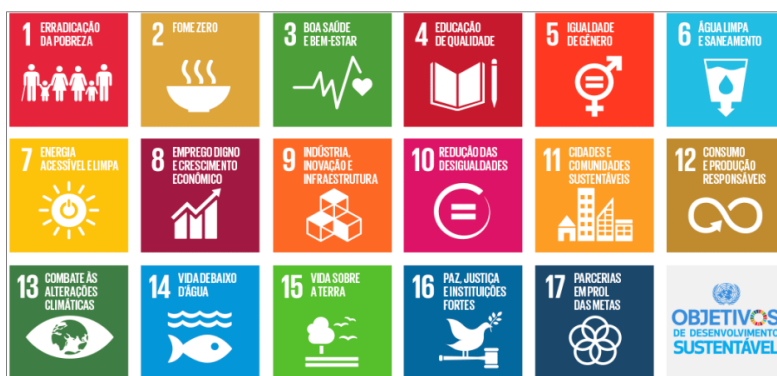
Figura 1: Objetivos de Desenvolvimento Sustentável – agenda 2030 (Nações Unidas Brasil, 2024)

A Figura 1 apresenta os 17 ODS, organizados em torno de cinco pilares — Pessoas, Planeta, Prosperidade, Paz e Parcerias — que orientam os esforços globais para um desenvolvimento sustentável. Esses pilares visam erradicar a pobreza e a fome, garantir dignidade e oportunidades para todos, promover o progresso econômico em harmonia com o meio ambiente, proteger os recursos naturais e o clima, e enfatizar a necessidade de colaboração global entre governos, setor privado e sociedade civil.