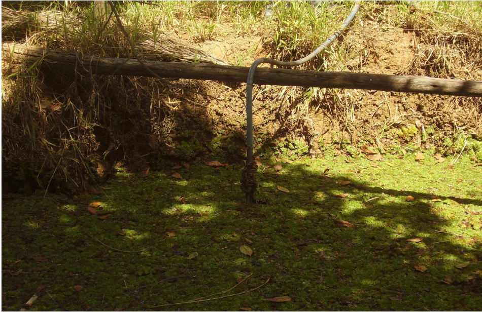
Foto 15: Comunidade de Pau D'Óleo em Montes Claros/MG: cacimba construída em propriedade rural. Observa-se a presença de algas, o que indica um comprometimento da qualidade da água. Autor: AFONSO, P.C.S., fev/2007.

Por volta de 1995, as Comunidades de Lagoa do Barro e Pau D'Óleo criaram uma Associação de Moradores que conseguiu a perfuração de poços comunitários, o que representou uma alternativa para a solução do problema. A água destinada às famílias, no entanto, é suficiente somente para o uso doméstico e para os animais criados próximos às casas. Os geraizeiros consideram que a água é de boa qualidade, mas é insuficiente e o que consideram mais grave é “ água cobrada ”. O valor monetário a que se referem é o preço da energia elétrica cobrado mensalmente aos usuários. “ O poço melhorou nossa vida, mas não resolveu o problema. Eu me sinto ofendido de ter que pagar pela água que eu e minha família usa ” (Sr. C.C., Comunidade de Pau D'Óleo).