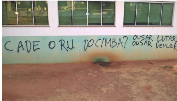
Figura 01– Primeira inscrição simbólica.