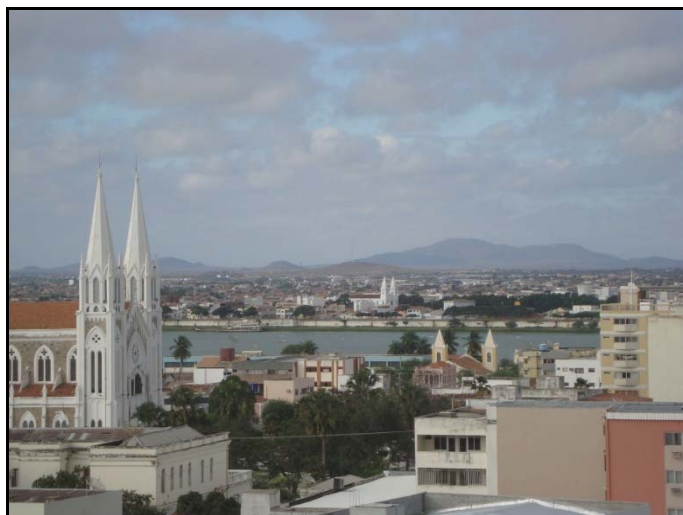
FOTO 1 – Petrolina (frente) e Juazeiro (fundo), separadas "apenas" pelo Rio São Francisco.

Petrolina e Juazeiro integram uma mesma rede urbana, polarizada tanto por Salvador, quanto por Recife. Com uma localização estratégica, equidistante das principais capitais do nordeste, ambas cumprem importante papel de vetorizar dinâmicas de desenvolvimento regional, a despeito de polarizar espaços caracterizados pela pobreza, esvaziamentos populacionais e núcleos urbanos modestos. Separadas “apenas” pelo rio São Francisco (Foto 1), compartilham praticamente das mesmas condições de desenvolvimento, inclusive, recebendo recursos federais oriundos da SUDENE e CODEVASF.