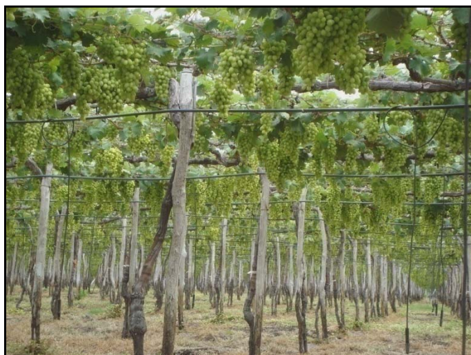
FOTO 2 – Cultura irrigada de uva (Petrolina). Este é o principal produto da agricultura irrigada da região de Petrolina e Juazeiro.

O governo federal tem presença marcante nas duas cidades, com obras do PAC (Programa de Aceleração do Crescimento) e programas como o Bolsa Família. De fato, tais programas delineiam alternativas aos efeitos originados de desequilíbrios observados entre dinâmica econômica e demográfica.