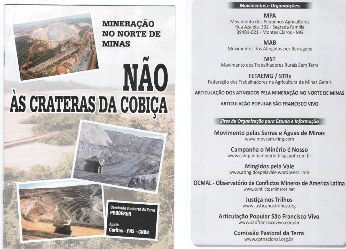
Figura 3 – Capa e contra-capa do manifesto contra a mineração no Norte de Minas, em 2012.

No mês de abril de 2013 foi realizada no município de Janaúba/MG uma audiência pública, com a participação de 600 pessoas em auditório, para discutir as conseqüências ambientais da exploração de ouro no município de Riacho dos Machados. Chama a atenção nesse evento, a participação da população urbana em geral do município de Janaúba/MG e de produtores rurais do perímetro irrigado do Gorutuba. Trata-se de fruticultores irrigantes que utilizam água da barragem Bico da Pedra, por meio de canais de concreto. A referida barragem abastece também a população urbana de Janaúba. O barramento Bico da Pedra foi construído no leito do Rio Gorutuba. O processo de licenciamento ambiental da empresa mineradora de ouro Carpathian Gold Inc. prevê construção da barragem de rejeitos próximo a um rio da bacia do Gorutuba. Há a formação no vale do Gorutuba de uma concepção sobre os riscos de contaminação das águas, com conseqüências diretas para o abastecimento urbano de Janaúba/MG, município com população de 65.387 habitantes (IBGE, Censo 2010), e para a fruticultura irrigada. (SEVÁ FILHO, 2011). Assim, uma articulação que envolve a população em geral e também fruticultores irrigantes está germinando na região. CASTRO (2010, p. 184) em estudos sobre conflitos pela água no México, identificou que