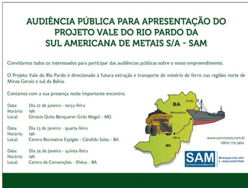
Figura 2 – Anúncio da Audiência Pública realizada no período de 22 a 24/01/2013.

Nesse sentido, trava-se na região uma movimentação social contrária a exploração de minério de ferro e de ouro. Audiências públicas, conforme exemplificado na Figura 2, já foram realizadas em municípios da região, principalmente, Grão Mogol e Janaúba 2 . Além de manifestações públicas diversas.