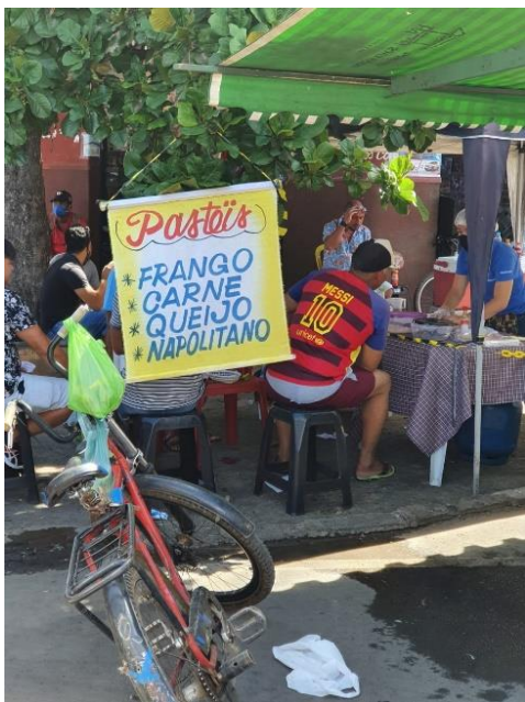
Figura 6 – Espaços de socialização

pertences, caixas, veículos e produtos. A figura 5 mostra um dos feirantes descascando milho dentro de um caminhão. É possível abstrair que o objeto seja um veículo, pois nesse momento, ele atua como um imóvel, um ambiente construído. Também se percebem mais mobiliários conformando outros ambientes, em frente ao caminhão, como um balcão de atendimento e exposição de mercadoria.