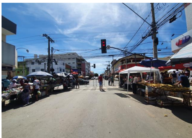
Figura 2 – Novo arranjo das barracas da feira dominical na Av. Castelar Prates

As figuras 2 e 3 mostram um importante cruzamento do bairro, onde se encontram as principais Avenidas: Castelar Prates e Francisco Gaetani. Esse ponto é considerado um “nó”, tanto viário, como de referência e concentração de funções. Nesse exato ponto geográfico, inicia-se a feira livre. Neste ano, a feira se adaptou a novas regras e configurações, mantendo um espaçamento maior entre as barracas, com uma menor quantidade de unidades, sem o toldo que fechava a via, criando dois corredores no centro da avenida. Também se pode perceber uma quantidade de feirantes e visitantes utilizando máscaras (uns de maneira correta, outros incorretamente), e a presença de funcionários da saúde, aspergindo álcool nas mãos dos transeuntes. Claramente esvaziada, a feira resiste.