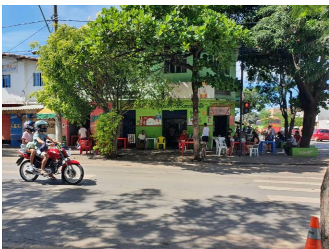
Figura 4 – Bares com mesas na calçada

A figura 4 refere-se a uma esquina da Avenida Castelar Prates, em que se localiza o bar Whisky Zito, ponto de encontro e de referência durante a semana e aos finais de semana. Nas manhãs de domingo, assumem um caráter ainda mais marcante, em função de estar muito próximo da feira. Neste ponto, observam-se pessoas sem máscara, o que se justifica pelo consumo de bebidas e alimentos. Logo, pode-se afirmar que o funcionamento do bar foi menos afetado pela pandemia, já que continua sendo utilizado com ocupação razoável durante todos os dias da semana.