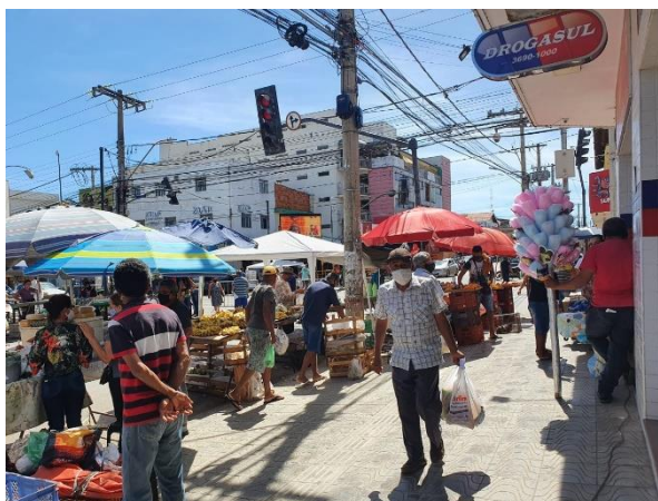
Figura 3- Cruzamento da Av. Castelar Prates com Av. Francisco Gaetani

A figura 4 refere-se a uma esquina da Avenida Castelar Prates, em que se localiza o bar Whisky Zito, ponto de encontro e de referência durante a semana e aos finais de semana. Nas manhãs de domingo, assumem um caráter ainda mais marcante, em função de estar muito próximo da feira. Neste ponto, observam-se pessoas sem máscara, o que se justifica pelo consumo de bebidas e alimentos. Logo, pode-se afirmar que o funcionamento do bar foi menos afetado pela pandemia, já que continua sendo utilizado com ocupação razoável durante todos os dias da semana.