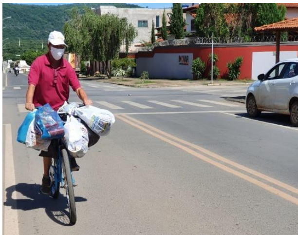
Figura 1 – Transporte por bicicleta na Av. Castelar Prates

As figuras 2 e 3 mostram um importante cruzamento do bairro, onde se encontram as principais Avenidas: Castelar Prates e Francisco Gaetani. Esse ponto é considerado um “nó”, tanto viário, como de referência e concentração de funções. Nesse exato ponto geográfico, inicia-se a feira livre. Neste ano, a feira se adaptou a novas regras e configurações, mantendo um espaçamento maior entre as barracas, com uma menor quantidade de unidades, sem o toldo que fechava a via, criando dois corredores no centro da avenida. Também se pode perceber uma quantidade de feirantes e visitantes utilizando máscaras (uns de maneira correta, outros incorretamente), e a presença de funcionários da saúde, aspergindo álcool nas mãos dos transeuntes. Claramente esvaziada, a feira resiste.