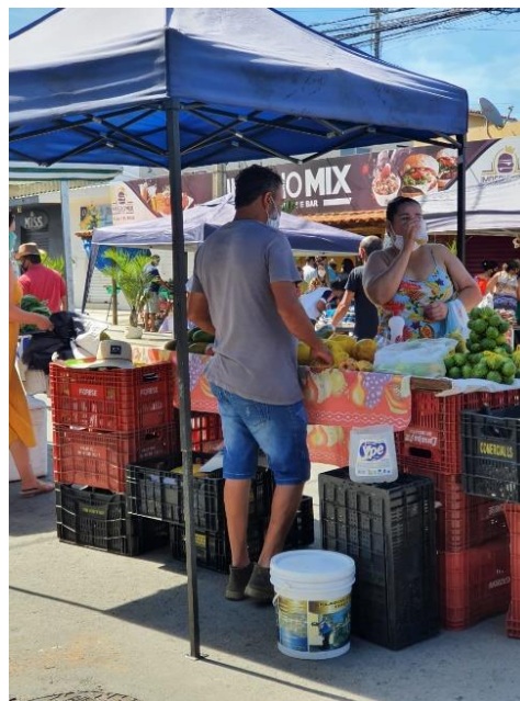
Figura 7 – Espaços de socialização

Nessa mesma direção, as imagens 6 e 7 registraram momentos de encontros em que duplas ou grupos conversavam, descontraidamente, consumindo algum produto da feira, utilizando mobiliários improvisados. Tais momentos são valiosos, ilustram o universo de possibilidades que se abre, enquanto a rua está disponível para a apropriação. Aqui, considera-se que a urbanidade é construída a partir do consumo, mas muito além dele. O comércio se comporta como atrativo, mas o que sobressaem são os contatos, a liberdade de circular ao ar livre, ver e ser visto, viver a festa à que Lefebvre (1999) se refere.