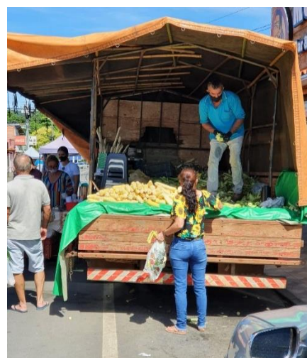
Figura 5 - Apoios da feira

Um dos aspectos que se destaca na feira é a maneira que as pessoas se apropriam da rua, criando novos arranjos espaciais, criando micro-territórios com seus