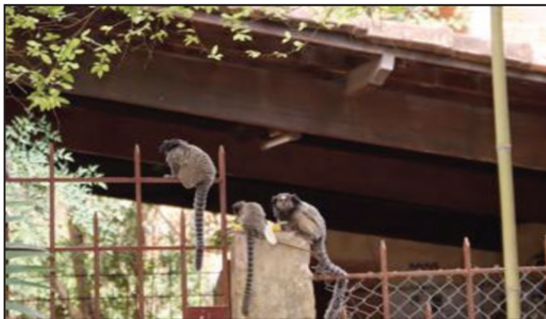
Figura 6. Micos se alimentando em residência.

Já na figura 6, constatamos que não somente as aves, mas também outros animais também estão passando pelo processo de perda de território, como os micos na figura seguinte. Neste caso, conforme relato da proprietária da casa, são dois grupos que todos os dias circulam pelo quintal e interior da casa, caso encontrem a janela aberta, os animais adentram e se servem do alimento disponível. Quando os animais se encontram em grupos, eles brigam, tornando necessário que alguém da casa interfira para evitar que eles se machuquem.