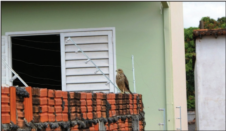
Figura 5: Gavião pousado em muro de residência.

Uma outra situação que corrobora o tema em estudo é a presença de um casal de gavião da espécie carijó em rua na vila Guilhermina, onde tem um ninho e circula pela região em busca de alimento, chegando até a atacar os transeuntes. A figura 5 comprova o fato acima descrito.