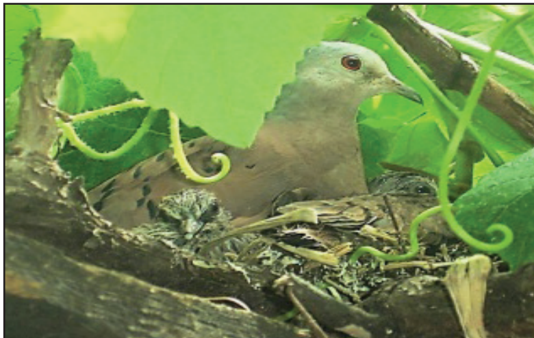
Figura 3 : Ninho de pássaro em parreira de quintal.