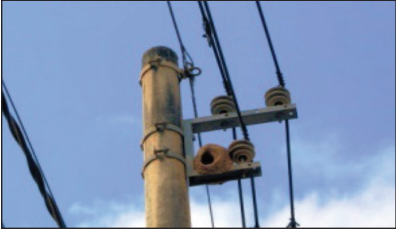
Figura 4: Casa de João de Barro em rede elétrica.