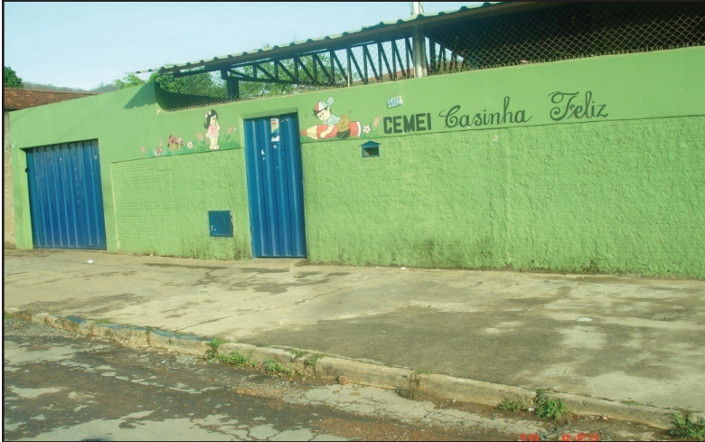
Figura 1: Foto do CEMEI- Casinha Feliz