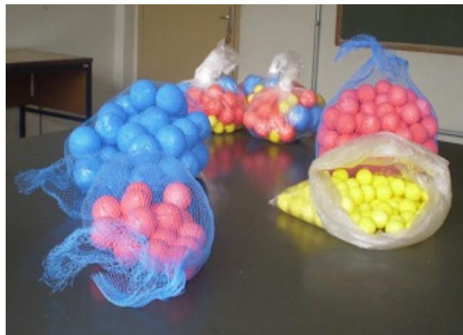
Figura 1: Bolinhas coloridas usadas nos modelos para representar os átomos: bolinhas amarelas: átomos de hidrogênio, bolinhas vermelhas: átomos de carbono e bolinhas azuis: átomos de oxigênio.

A equação química balanceada dos processos de respiração e de fotossíntese foi dada aos alunos: 6,7