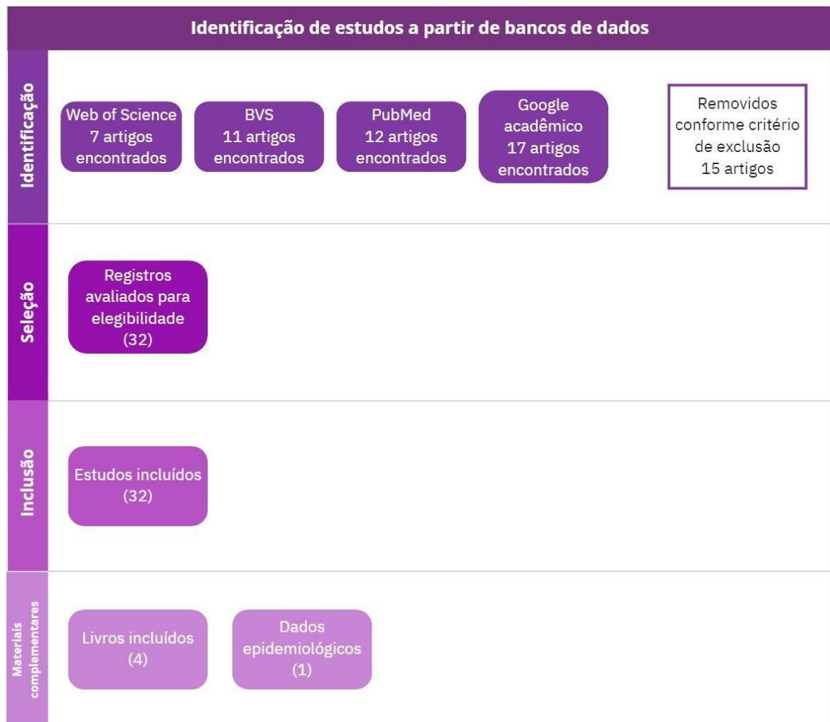
Figura 1: Fluxograma da pesquisa baseado no método PRISMA.

apresentados nesse estudo, foram inicialmente selecionados 44 artigos, nos quais foram avaliados os títulos que relacionam com o tema, período de publicação, localidade e data dos estudos, como mostrado na figura 1 (Identificação) . Após a leitura de cada artigo, foram selecionadas 32 publicações ( Fig. 1 Seleção e Inclusão ) que atendiam aos critérios de inclusão - artigos que apresentavam correlação entre as infecções causadas pela Klebsiella pneumoniae e Strongyloides stercoralis por meio de relatos de casos.