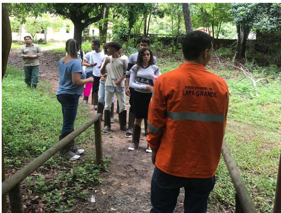
Figura 3. Os alunos acompanhados da professora regente da disciplina de Biologia