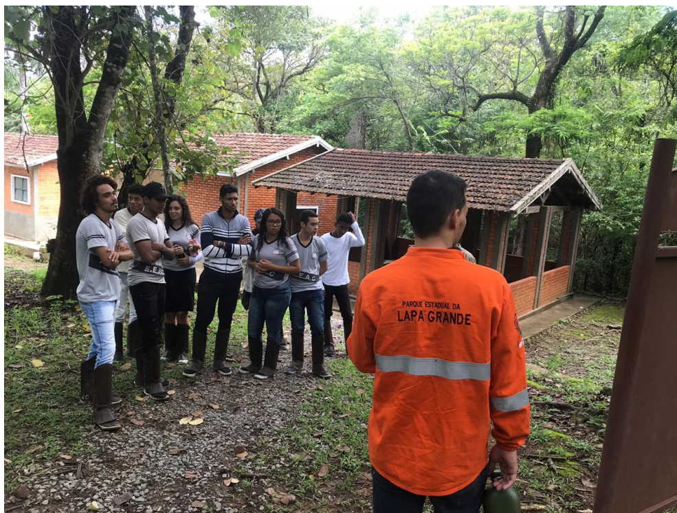
Figura 2. Procedimentos e orientações para fazer a trilha na mata

disciplina biologia e os guias do parque os alunos foram “desbravando” os arredores do parque onde foram debatidos diversos aspectos da vegetação preservada e a importância da sua conservação, como pode ser observado nas figuras 2, 3 e 4 .