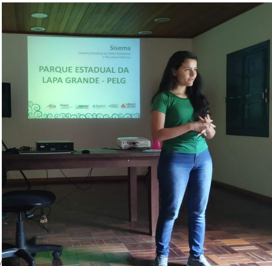
Figura 5. Apresentação das características do parque