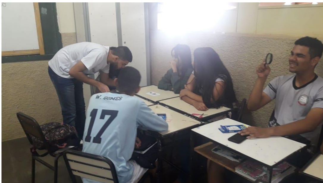
Figura 1: Alunos e discente na sala de aula observando os anéis de crescimento.

A metodologia utilizada foi um trabalho de campo, uma aula expositiva demonstrativa realizada no Parque Estadual da Lapa Grande para fixação do conteúdo ministrado em sala de aula.