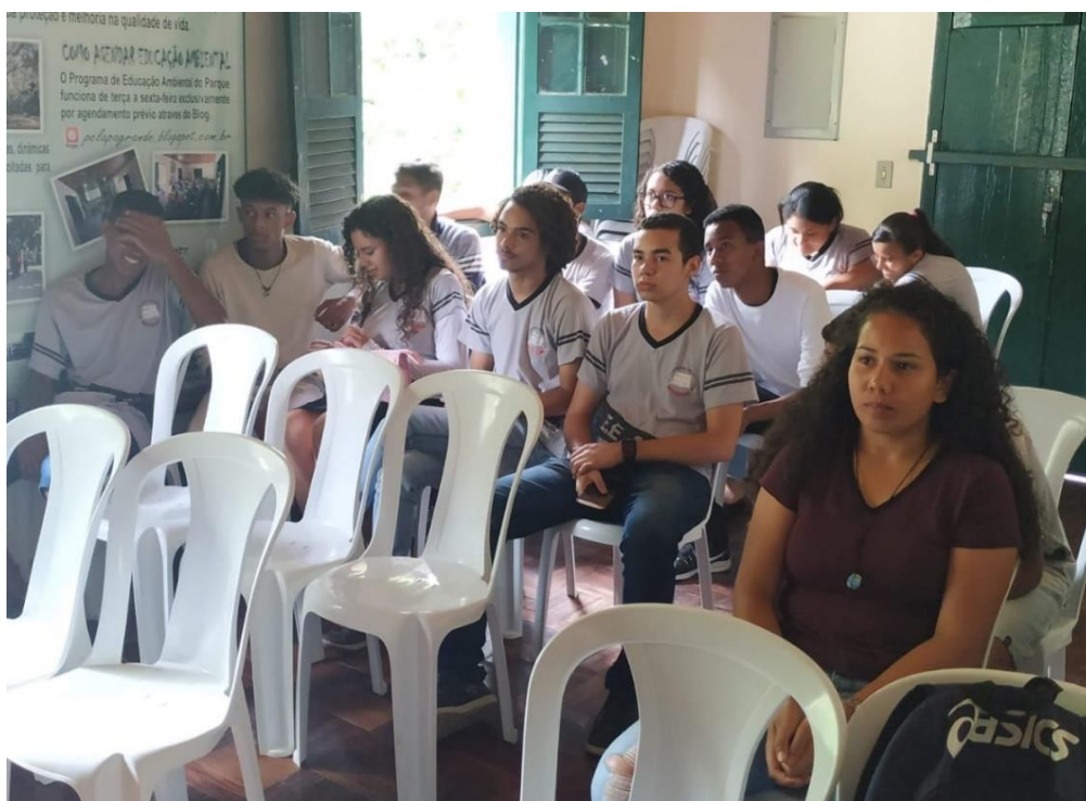
Figura 6. Momento tira dúvidas