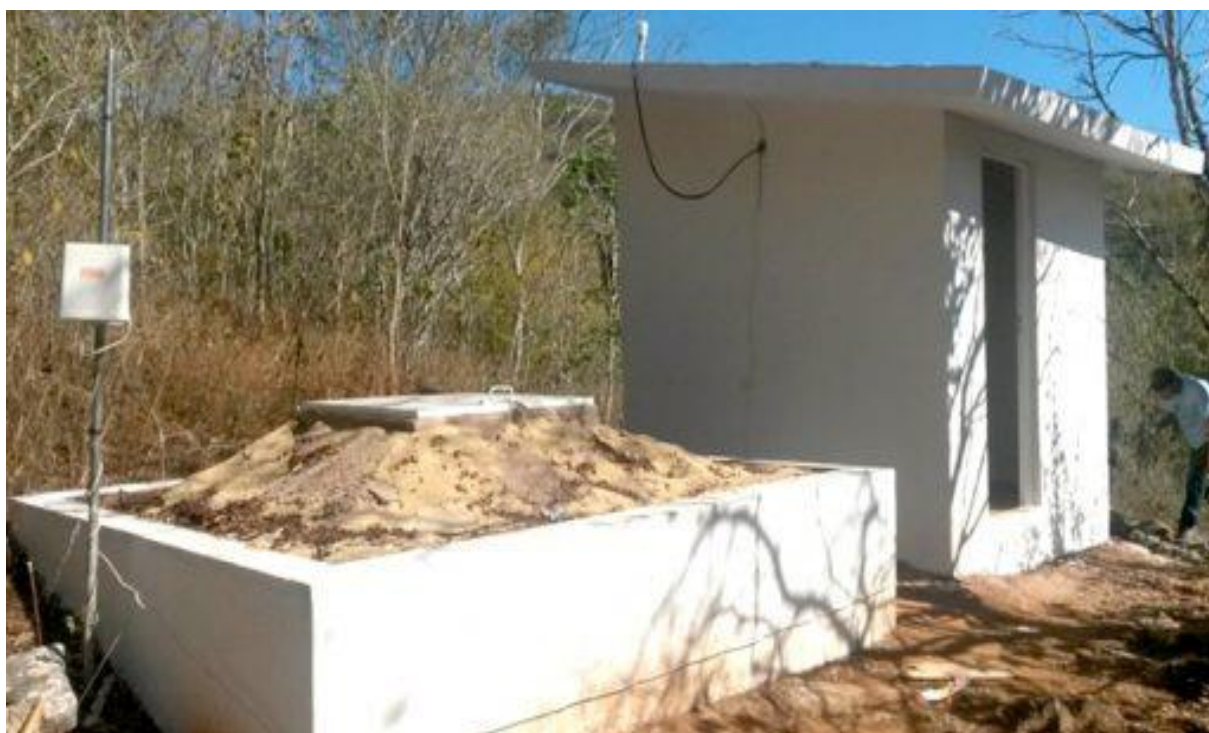
Figura 2: Estação Sismográfica MC01 da Unimontes

sismicidade local deste município. De forma concomitante, a Unimontes, por intermédio do Departamento de Geociências e do Centro de Estudos de Convivência com o Semiárido – CECS, adquiriu duas estações sismográficas com recursos conquistados a partir de projeto de pesquisa apreciado pela então Secretaria de Estado de Ciência, Tecnologia e Ensino Superior – SECTES e aprovado pela Fundação de Amparo à Pesquisa do Estado de Minas Gerais - FAPEMIG. A Figura 2 mostra as dependências de uma estação sismográfica da Unimontes instalada no Parque Lapa Grande.