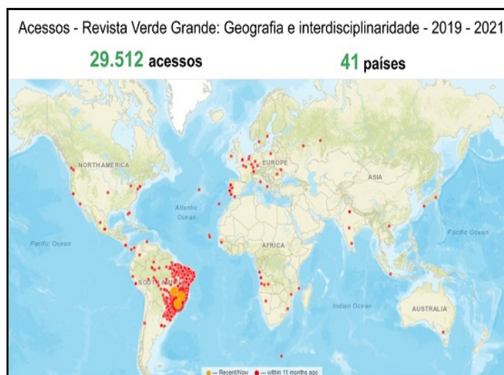
Figura 1: Acessos – Revista Verde Grande: geografia e Interdisciplinaridade; Dez. 2021.

Aproveitamos a oportunidade para fazer um breve balanço das publicações entre 2019 e 2021 nesse período o periódico vinculado ao Departamento de Geociências e ao Programa de Pós-Graduação de Geografia (PPGEO) da Unimontes lançou seis edições diferentes e alcançou 29.512 acessos de internautas de 41 países da América do Norte, América Central e Caribe, América do Sul, Europa, África, Ásia e Oceania. Até julho de 2022 atingimos a marca de 40 mil acessos conforme Figura a seguir.