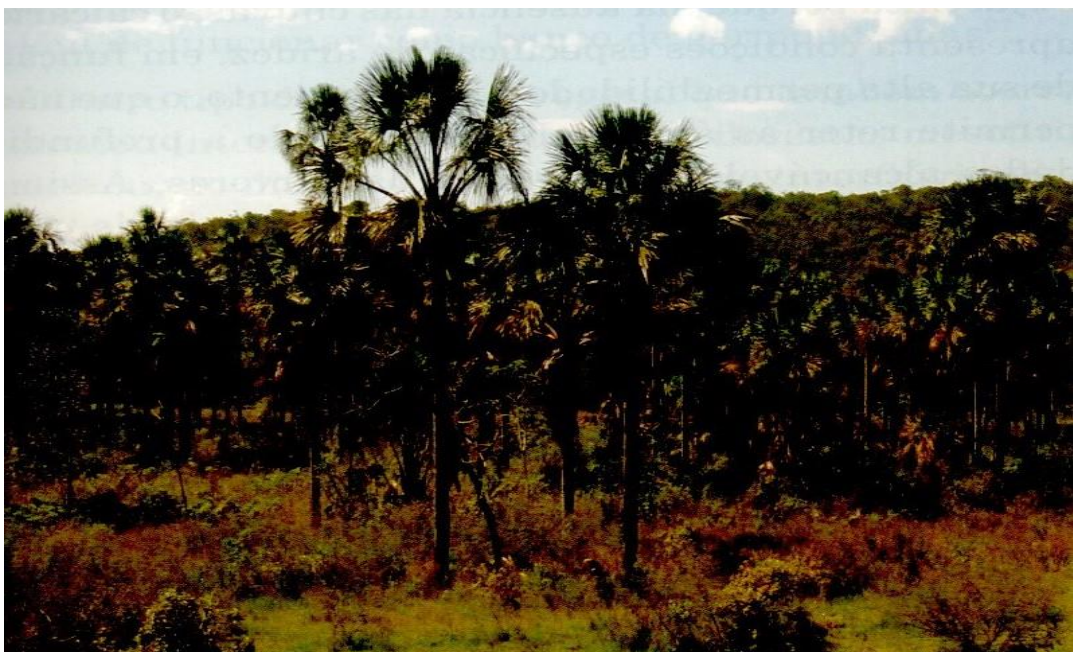
Figura 2: Registro das veredas – Eu sou o Cerrado (2014)

Fonte: IBGE, Benedito Alísio da Silva Pereira (1990)