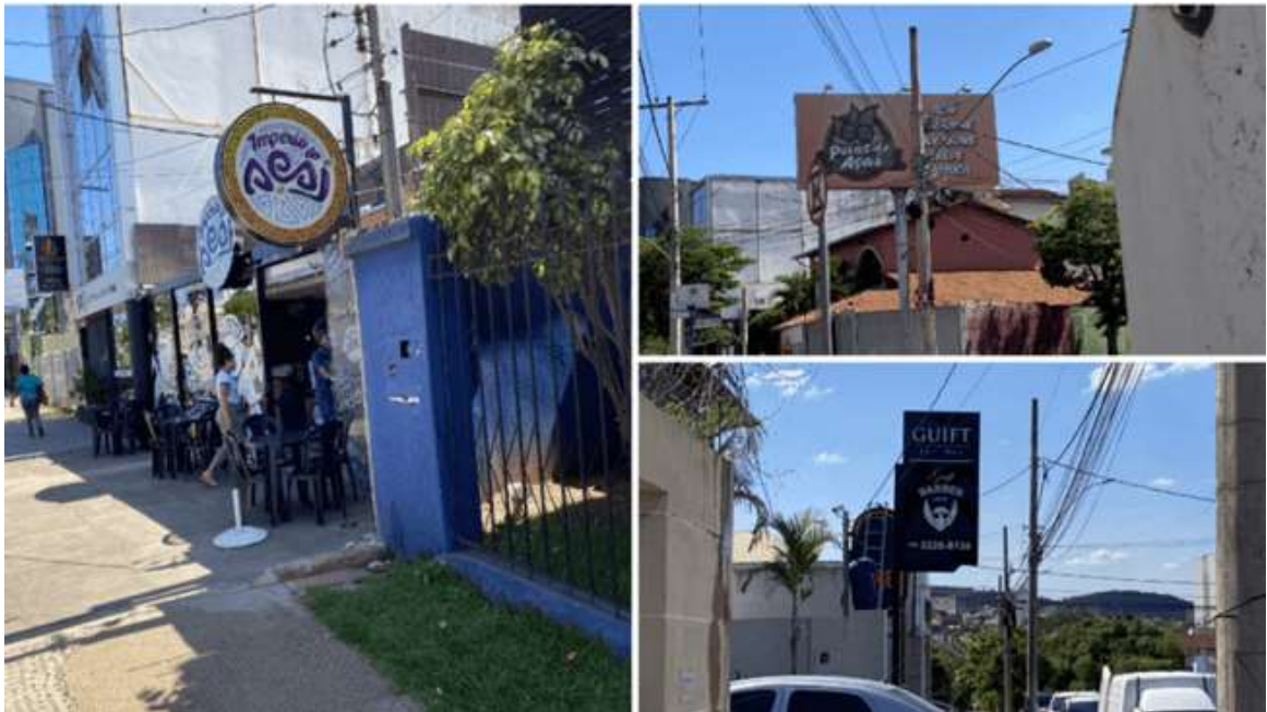
Figura 4: Aspectos comunicacionais

Alguns pontos comerciais da Avenida Deputado Esteves Rodrigues se destacam por suas construções estéticas, os mesmos possuem maior desenvolvimento em suas configurações espaciais com foco em atividades neurosensoriais (figura 4).