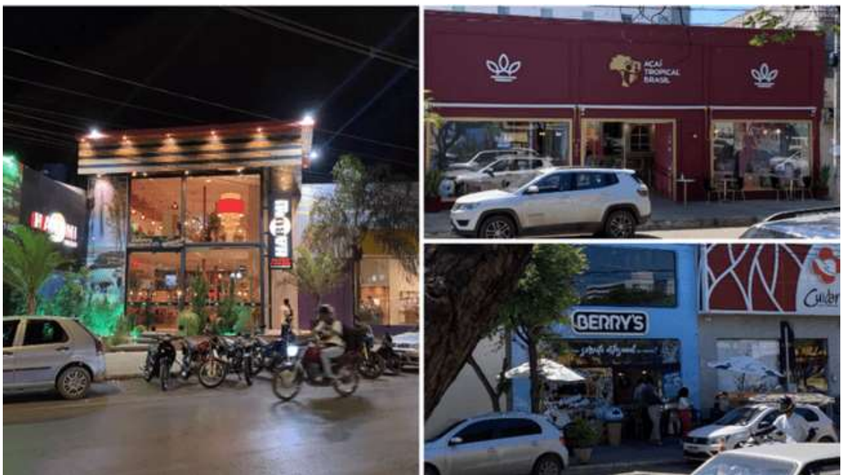
Figura 5: Logradouros estilizados

Estabelecimentos como as franquias Açai Tropical Brasil e Domino's Pizza e outros como o Harumi Sushi, Berry's e Pede Pizza, que se encontram na Avenida Deputado Esteves Rodrigues, apresentam estéticas próprias, mais bem desenvolvidas, com espaços instagramáveis 5 , estabelecendo uma diferenciação mais clara dentro do cenário da avenida, recebendo maior destaque, o que pode ser observado até pela iluminação no período noturno (figura 5).