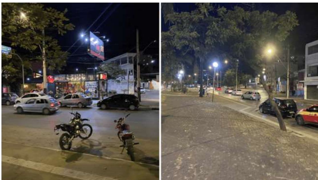
Figura 9: Fluxo na Avenida Sanitária

Levando em consideração o intenso fluxo da rua e da avenida em questão, uma estruturação de movimentação eficaz se faz necessária, principalmente na Av. Deputado Esteves Rodrigues, que apresenta um fluxo intenso e maior de veículos e pedestres. Ambas as vias apresentam as necessárias sinalizações, apresentando um fluxo organizado e fluído, com pouca incidência de dificuldades e percalços (figura 9).