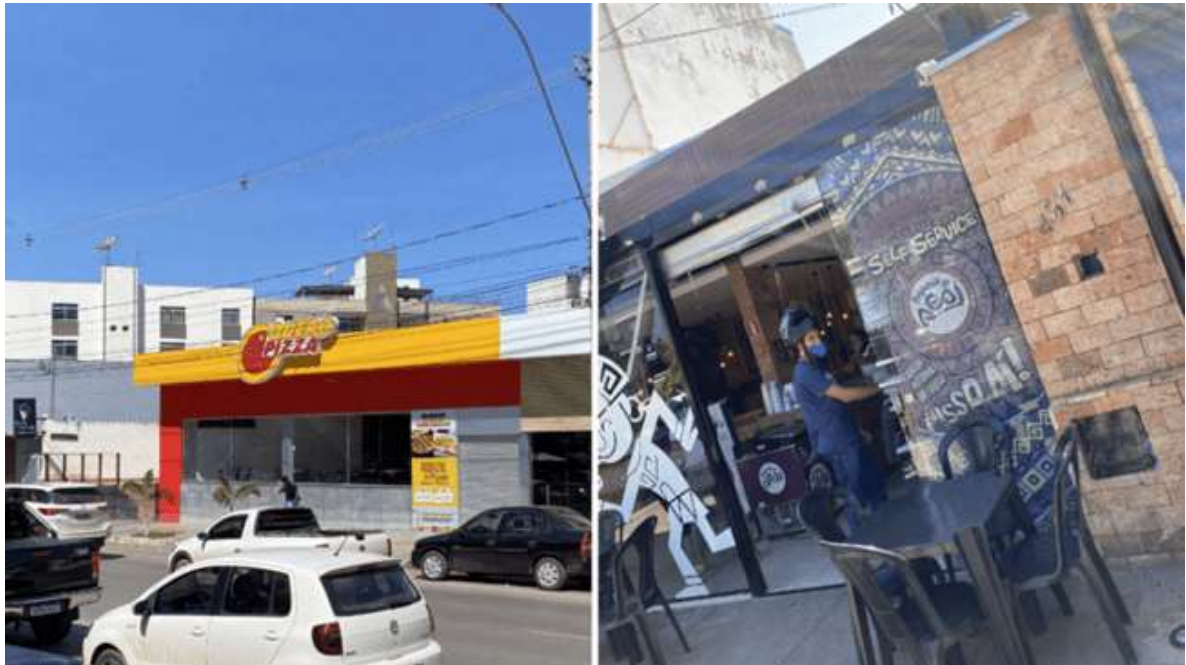
Figura 6: Pontos comerciais simples

temática e a experiência como diferenciais, podendo aparentar serem mais acessíveis, entregando também satisfação ao consumidor (figura 6).