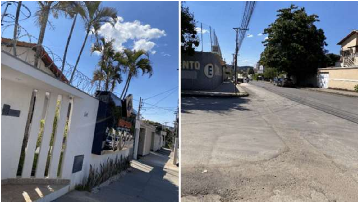
Figura 7: Aspecto residencial