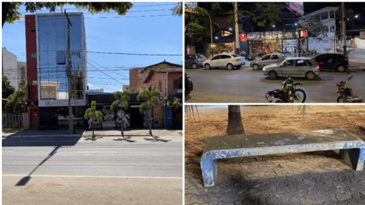
Figura 3: Aparência da Avenida Sanitária