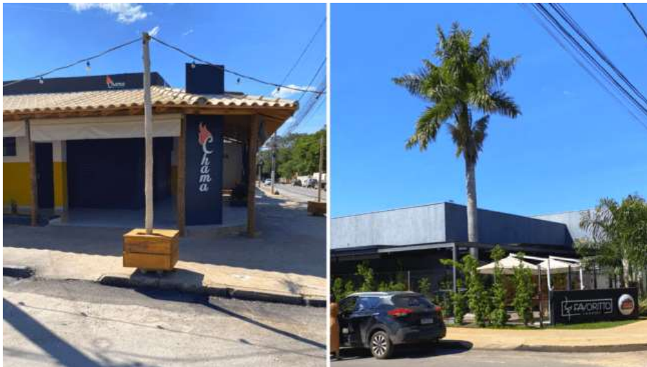
Figura 11: Favoritto Jardins e Chama Espetos

O consumo e a sociabilidade andam juntos, afinal o consumo também é uma manifestação social que se dá pelo movimento do capital, que continua alimentando o ciclo do sistema. Dessa forma a socialização por meio do capital gera um aspecto de segregação. Como discutido ao decorrer do artigo alguns pontos comerciais e espaços criam identificação com certos públicos, podendo os demais serem excluídos dos usos e ocupações de determinados bens e serviços, mesmo que de forma não explícita. Novamente a estética e a comunicação entram na composição desse cenário. Tomando por exemplo a Rua Eusébio Alves Sarmiento e seus pontos comerciais é possível perceber que determinados comércios se comunicam com públicos de diferentes classes sociais, não somente fundamentado no valor (preço) de seus bens e serviços, mas também na construção estética e comunicacional desses locais, criando diferentes perspectivas de possíveis experiências. De forma específica se pode tomar dois pontos comerciais da via analisada como exemplos, o restaurante Favoritto Jardins e o Chama Espetos (figura 11).