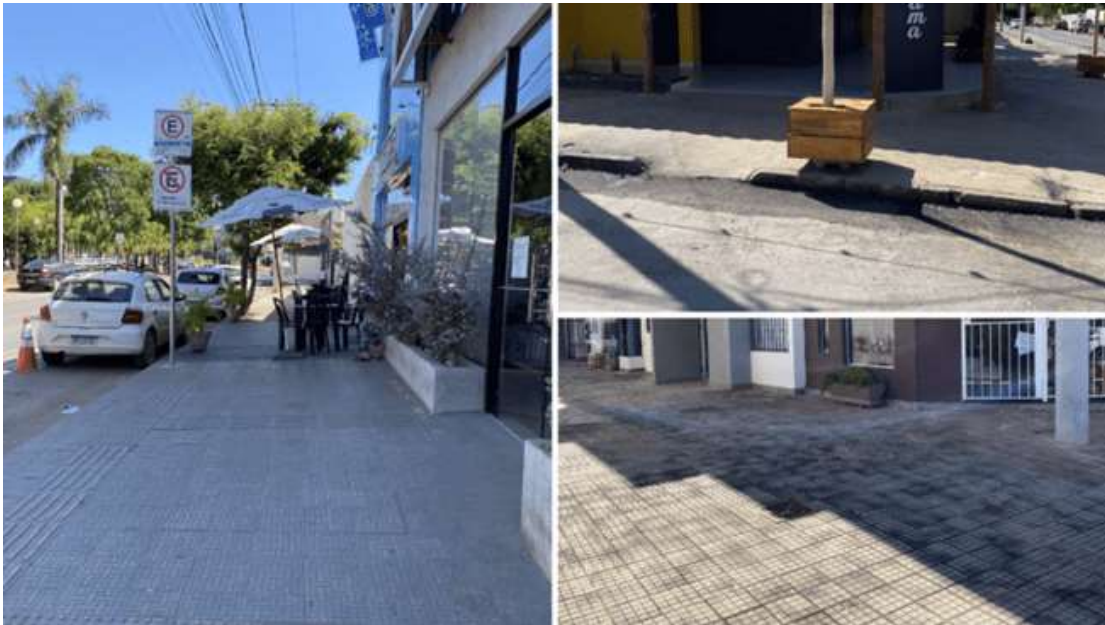
Figura 8: Caracterização dos pisos