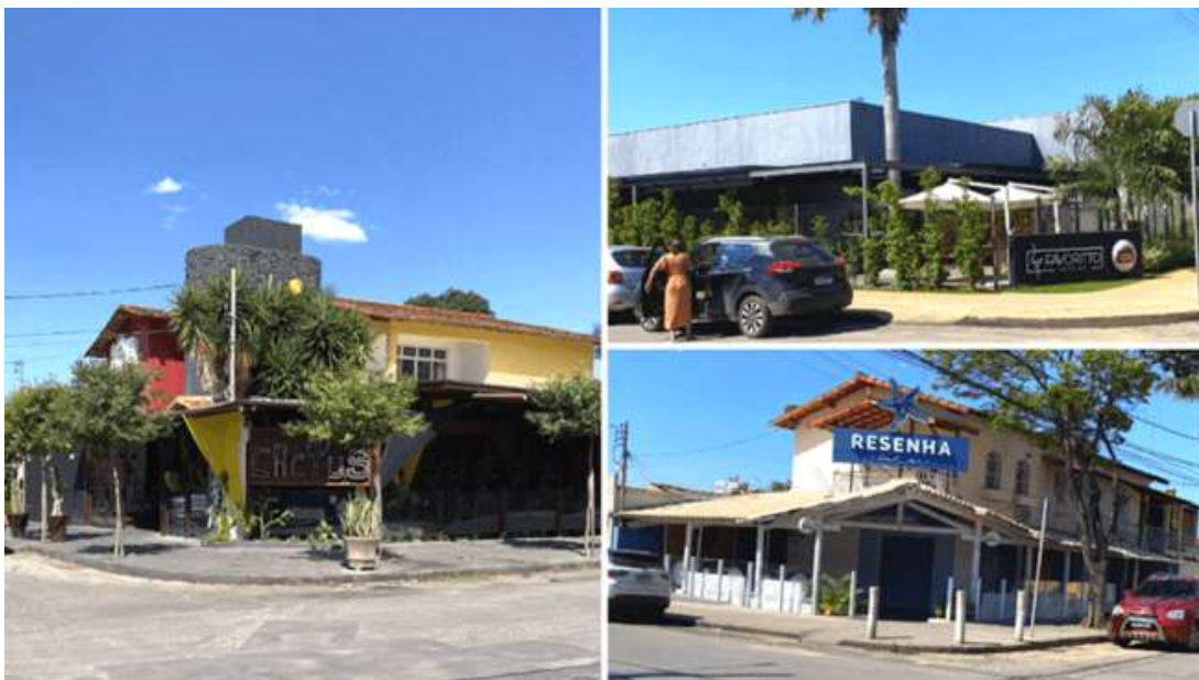
Figura 10: Pontos comerciais desenvolvidos

Na Rua Eusébio Alves Sarmiento essa transformação é clara, considerando que os logradouros se diferem pelas tipificações comerciais e residenciais. Os pontos comerciais que trabalham de forma mais evidente a estetização criam destaque em relação aos demais logradouros, diferenciando não somente suas funções específicas de venda/serviço e moradia, mas também comerciais conforme suas segmentações. Na rua em questão alguns pontos comerciais como bares e restaurantes criam um destaque considerável na construção da paisagem urbana através da temática que apresentam, como no caso dos restaurantes: Resenha, Favoritto Jardins, Cactus, entre outros, que deixam evidente suas manifestações temáticas com estéticas próprias (figura 10).