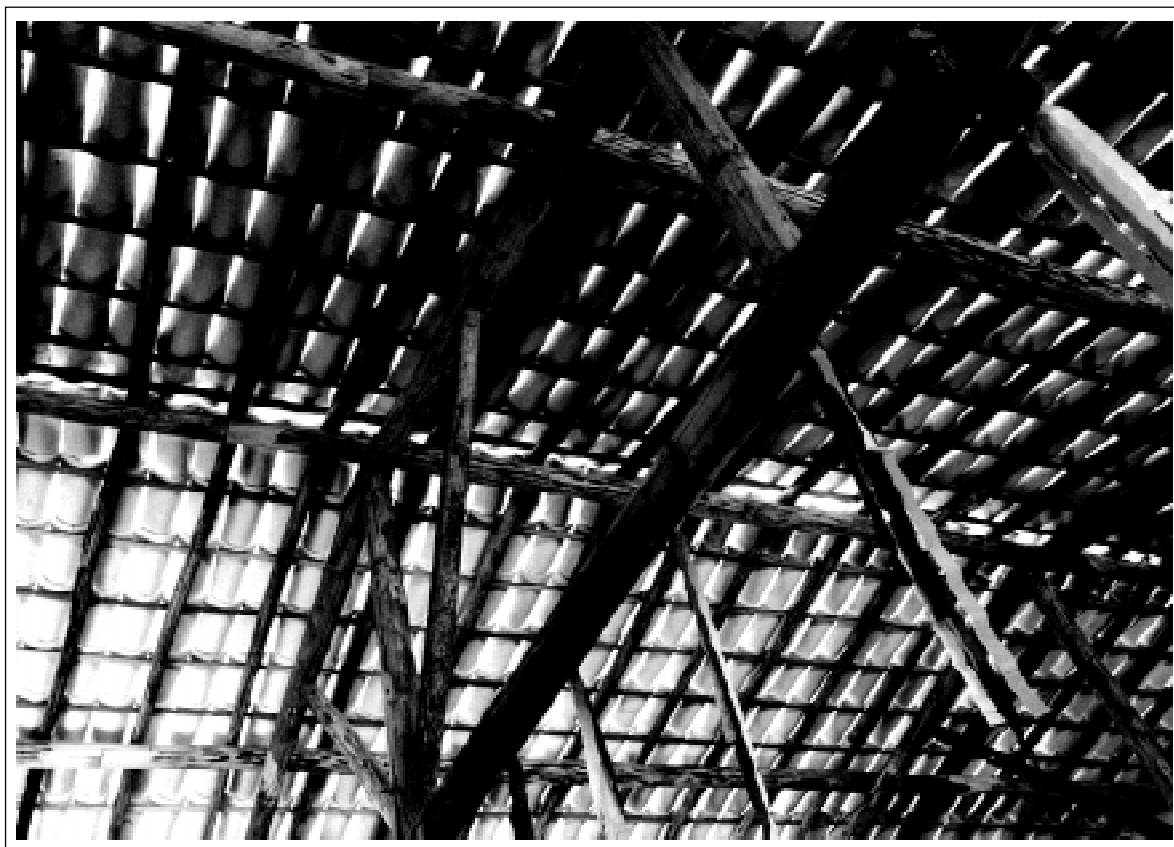
Inauguração Centro Comunitário Quilombola – Comunidade Taperinha – Pai Pedro – MG