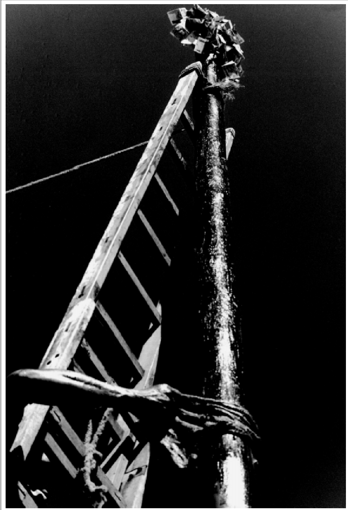
Pau de sebo – Festa do Rosário dos Homens Pretos de Minas Novas