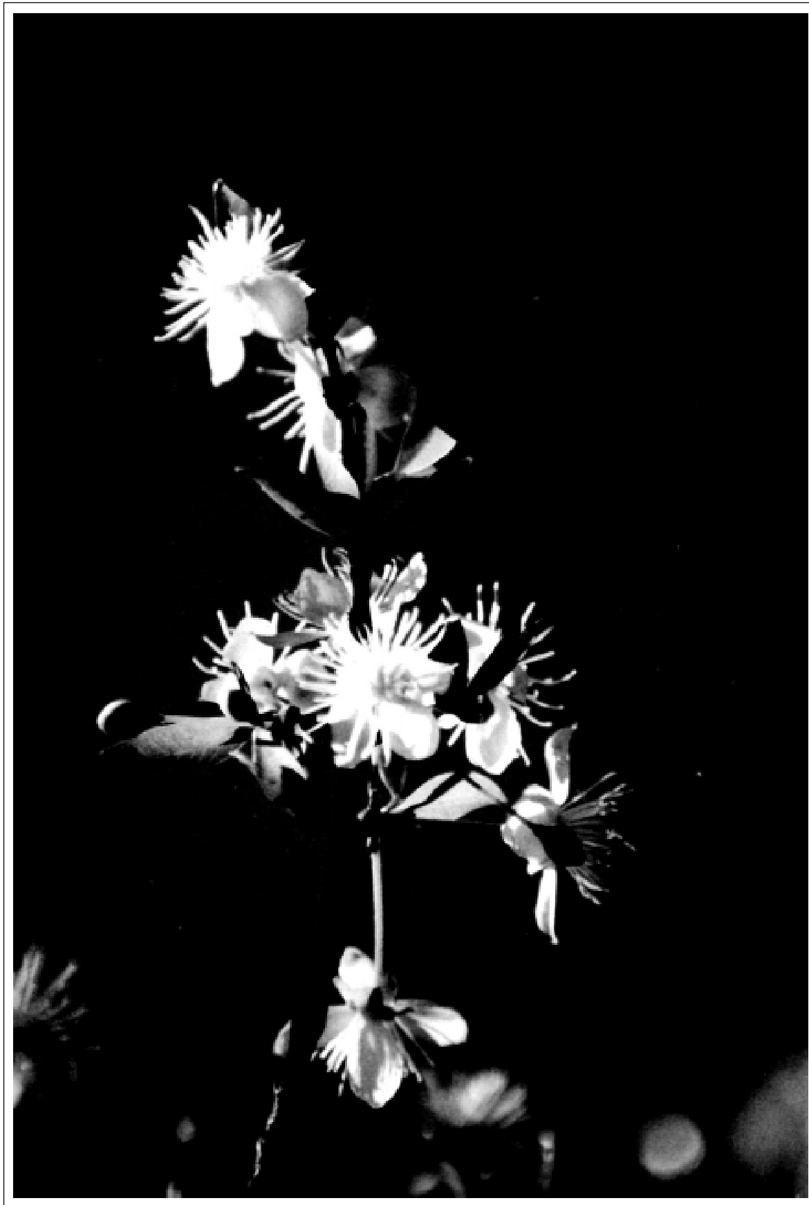
Flor de cagaita salpica de branco o sertão – Montes Claros – MG