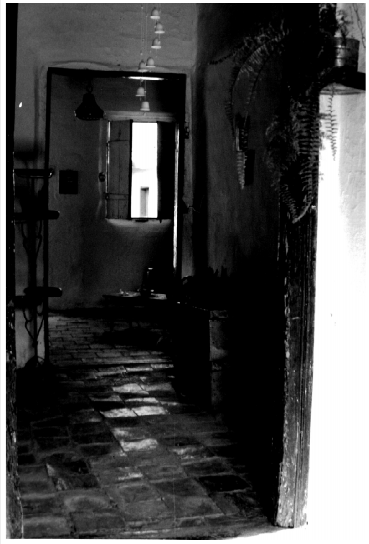
Interior – Lajotas e brilhos – Chapada do Norte – MG