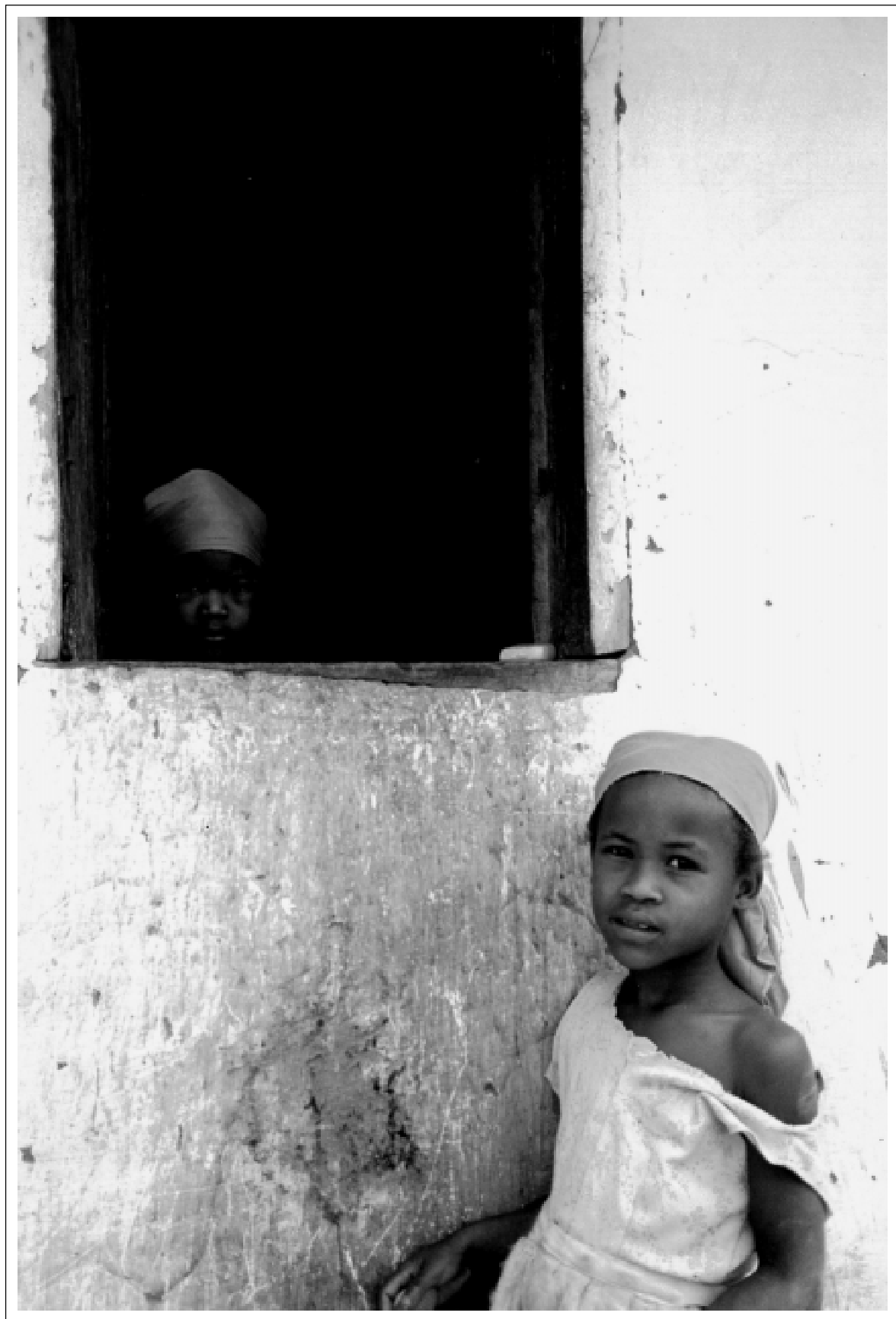
Rosa singelo - Comunidade de Poções