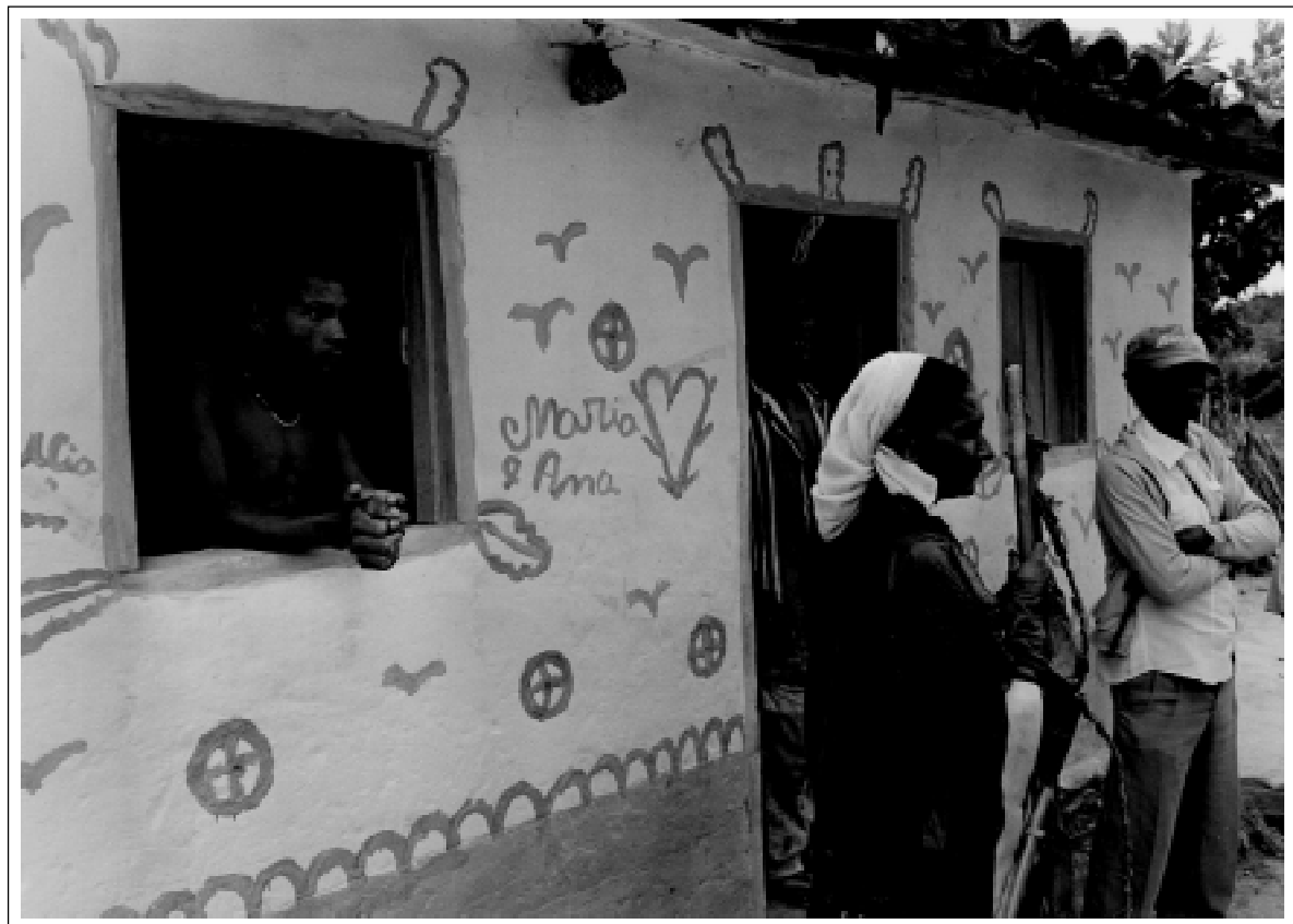
Festa na roça – Comunidade de Bem Posta – Minas Novas – MG